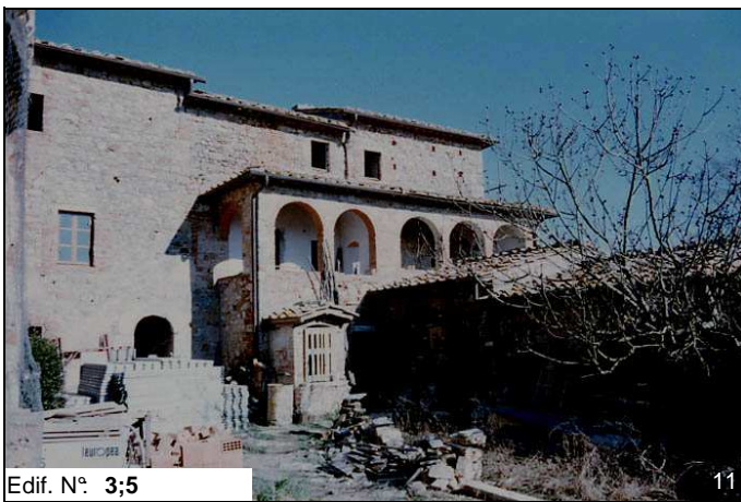
Edif. N° 3;5