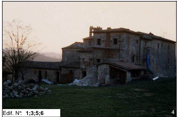
Edif. N° 1;3;5;6