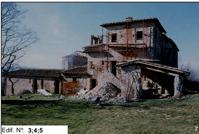
Edif. N° 3;4;5