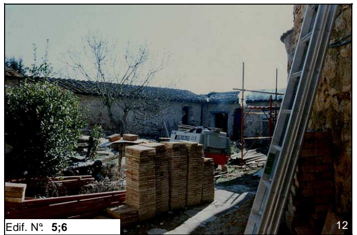
Edif. N° 5;6