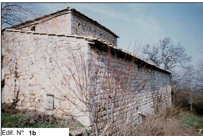
Edif. N° 1b