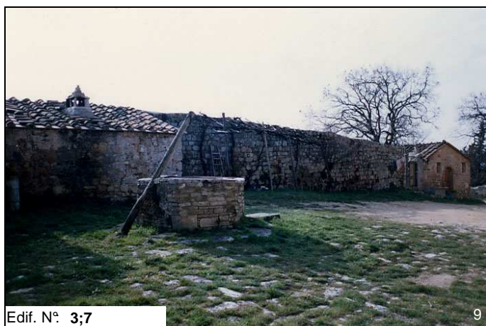
Edif. N° 3;7