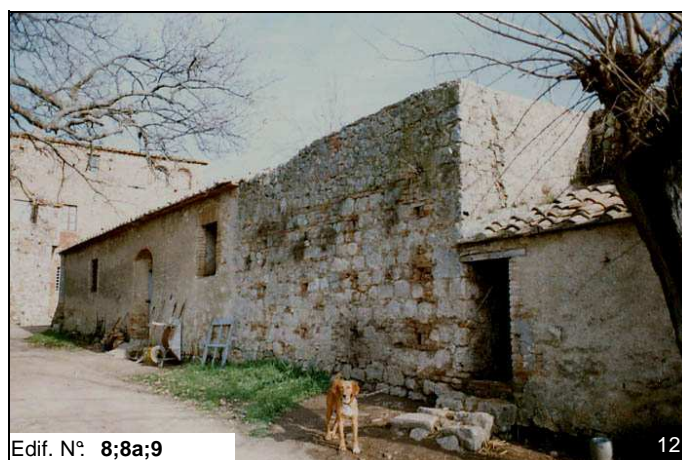
Edif. N° 8;8a;9