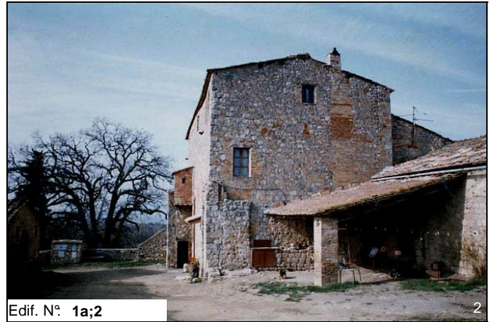
Edif. N° 1a;2