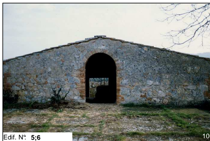
Edif. N° 5;6