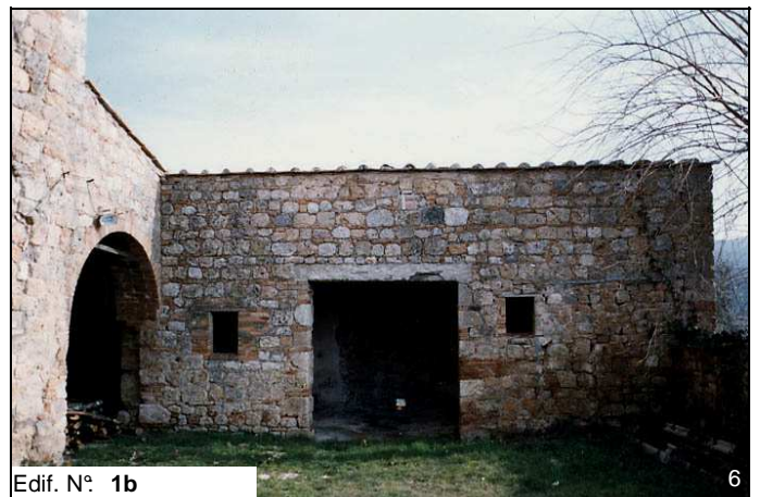
Edif. N° 1b