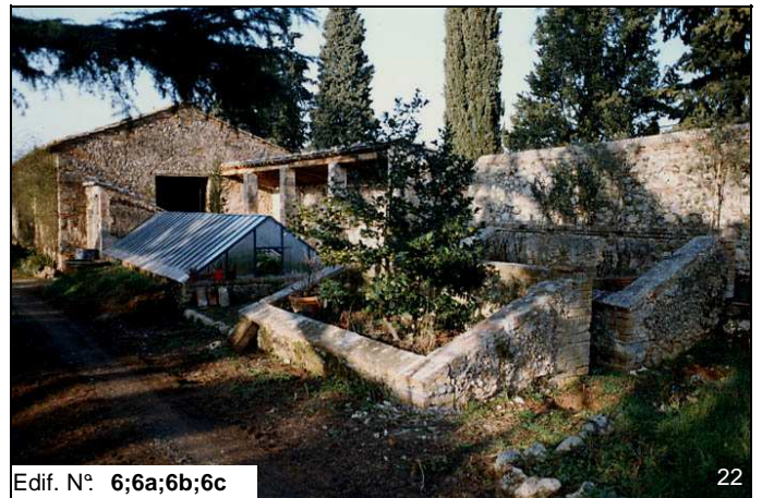
Edif. N° 6;6a;6b;6c