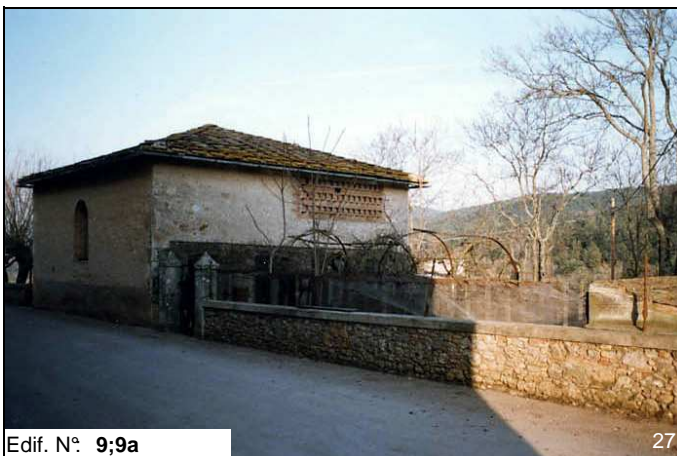
Edif. N° 9;9a