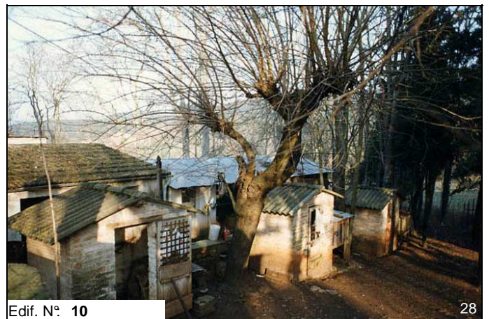
Edif. N° 10