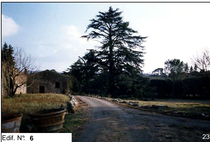
Edif. N° 6