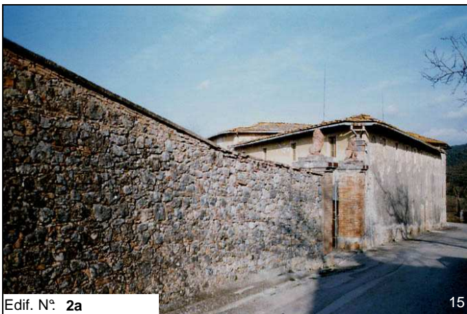
Edif. N° 2a