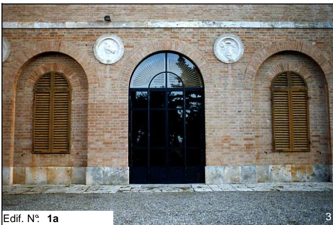
Edif. N° 1a