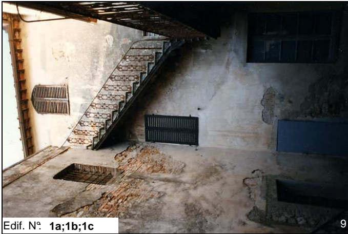
Edif. N° 1a;1b;1c