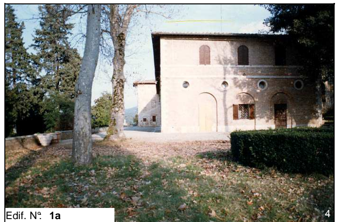
Edif. N° 1a