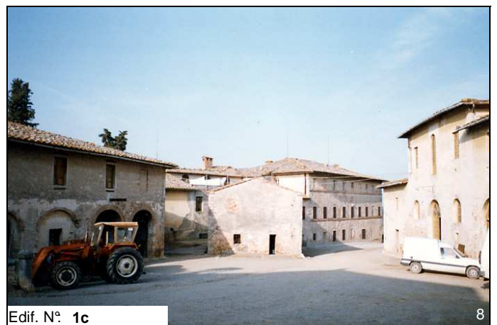
Edif. N° 1c