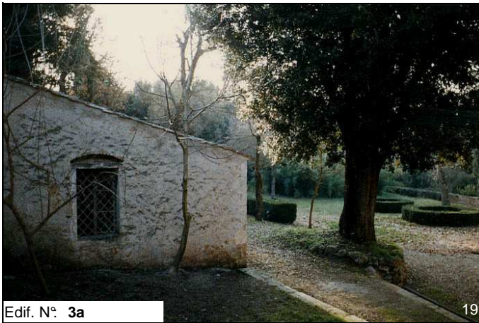
Edif. N° 3a