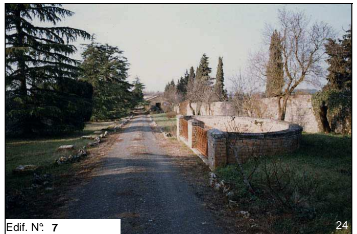
Edif. N° 7