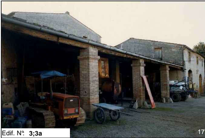
Edif. N° 3;3a