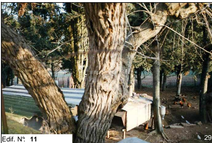
Edif. N° 11