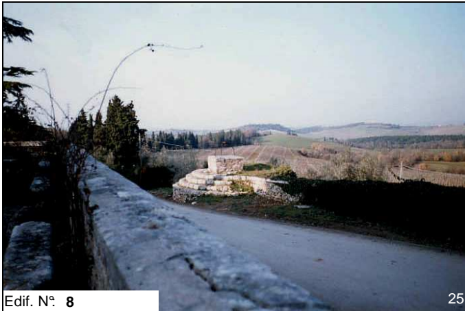
Edif. N° 8