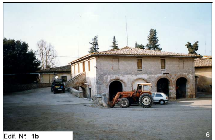
Edif. N° 1b