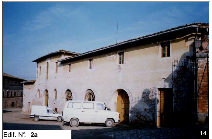
Edif. N° 2a