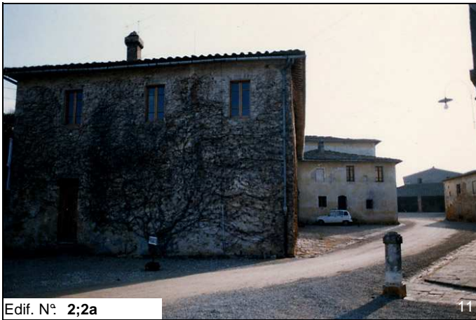
Edif. N° 2;2a