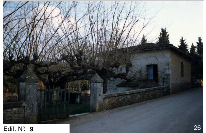
Edif. N° 9