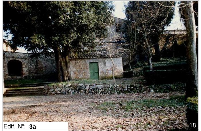
Edif. N° 3a