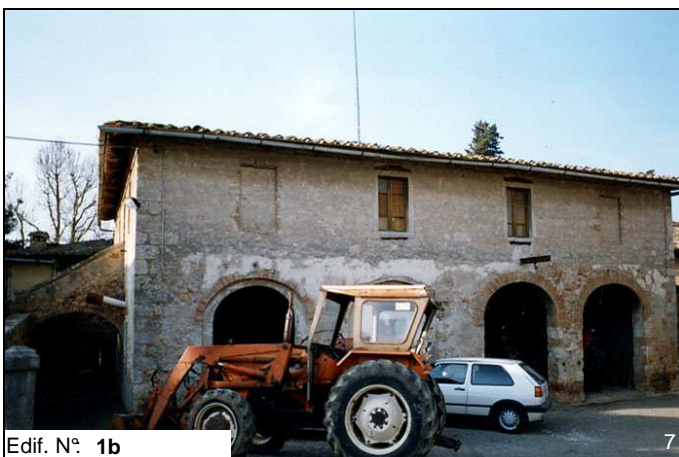
Edif. N° 1b