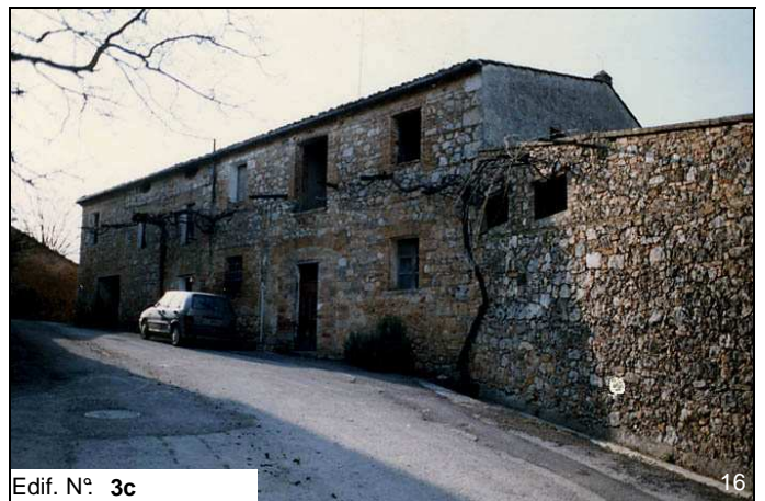
Edif. N° 3c