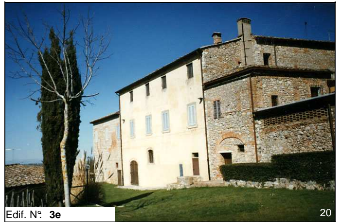
Edif. N° 3e