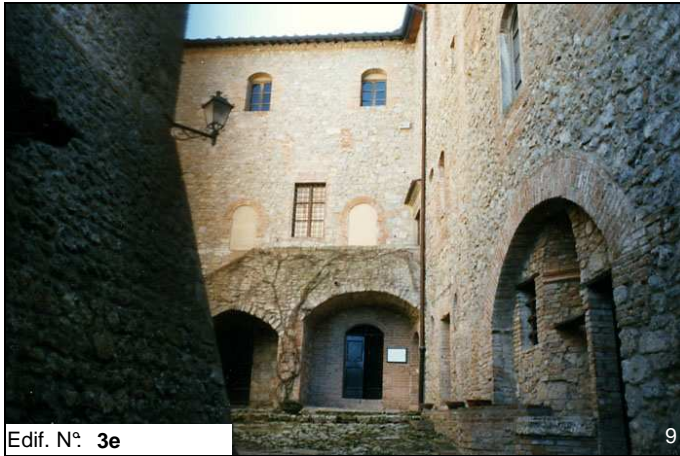
Edif. N° 3e