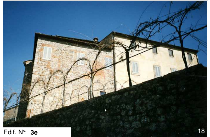
Edif. N° 3e