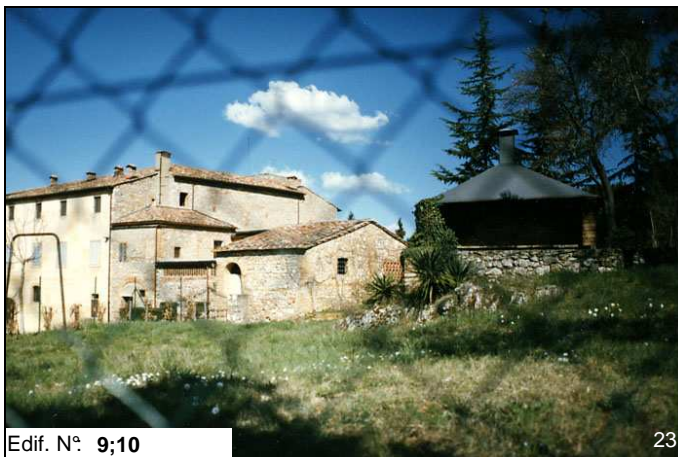
Edif. N° 9;10