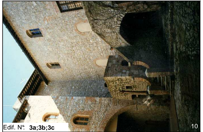
Edif. N° 3a;3b;3c