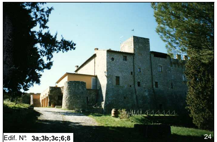
Edif. N° 3a;3b;3c;6;8