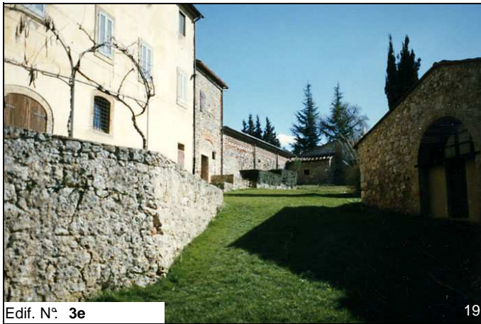
Edif. N° 3e