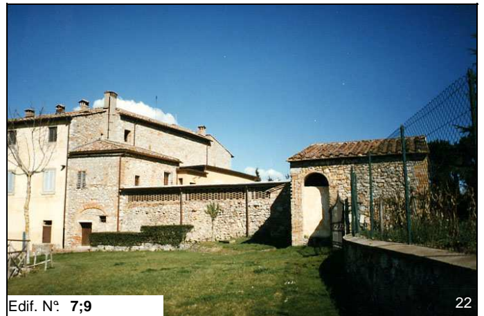
Edif. N° 7;9