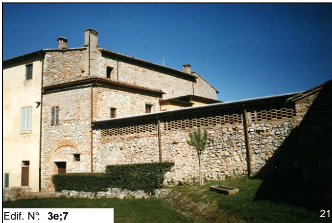
Edif. N° 3e;7