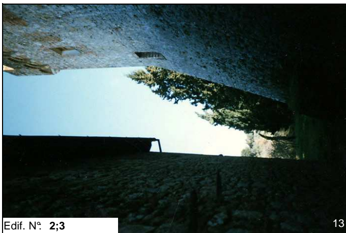
Edif. N° 2;3