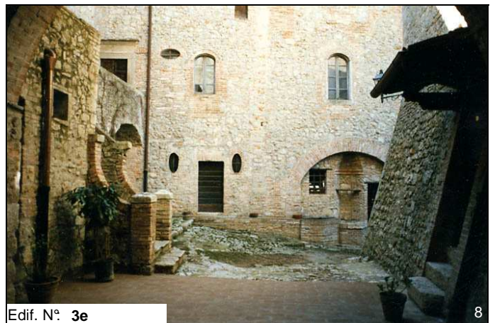
Edif. N° 3e