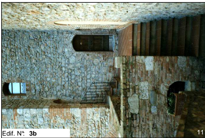
Edif. N° 3b