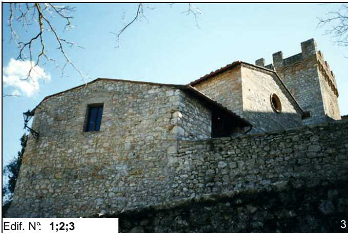
Edif. N° 1;2;3