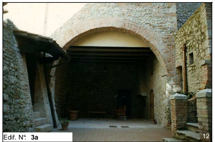
Edif. N° 3a