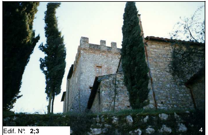
Edif. N° 2;3