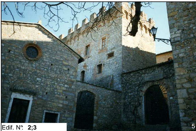
Edif. N° 2;3