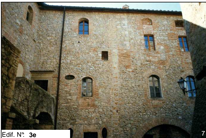
Edif. N° 3e