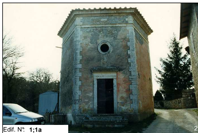
Edif. N° 1;1a