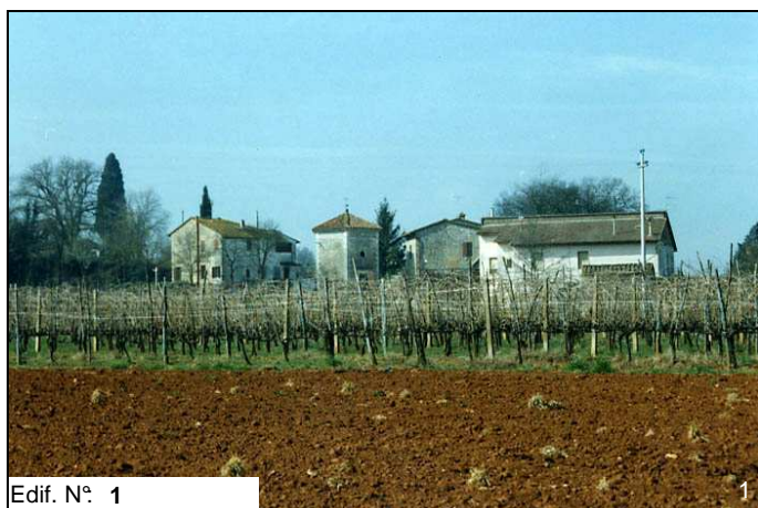
Edif. N° 1