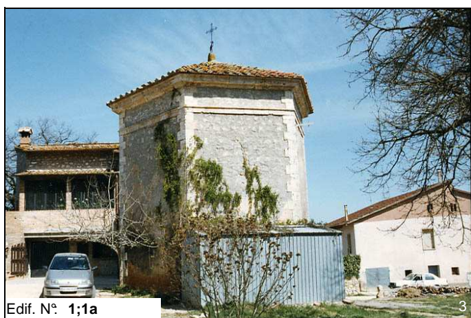
Edif. N° 1;1a