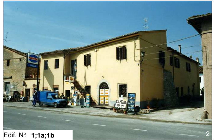
Edif. N° 1;1a;1b