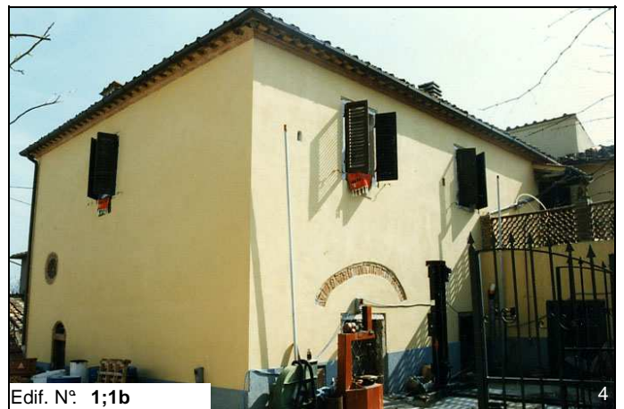
Edif. N° 1;1b