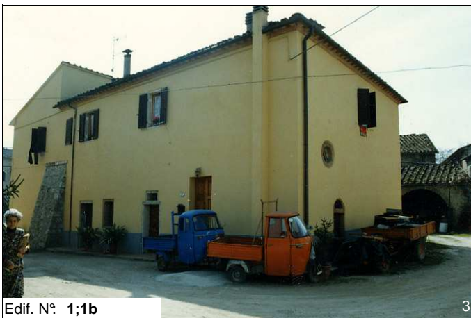
Edif. N° 1;1b