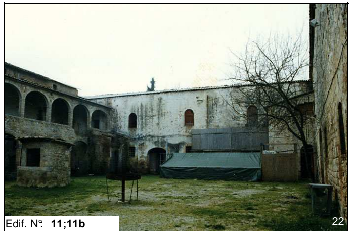
Edif. N° 11;11b