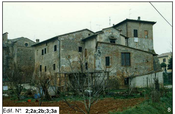
Edif. N° 2;2a;2b;3;3a