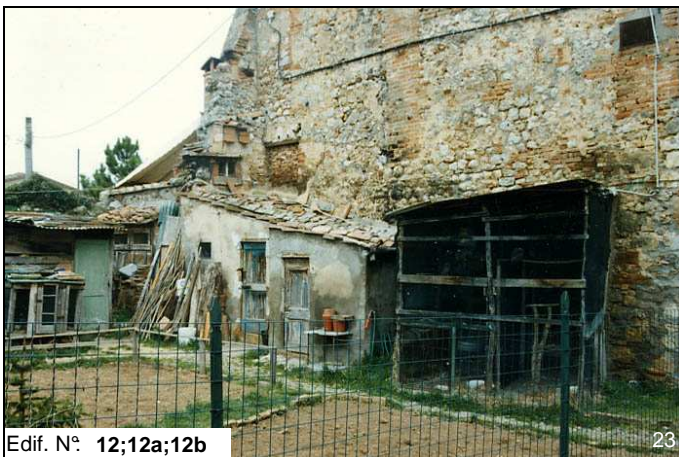
Edif. N° 12;12a;12b