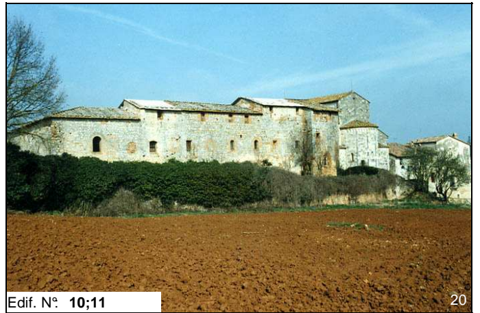
Edif. N° 10;11