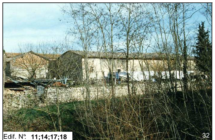
Edif. N° 11;14;17;18