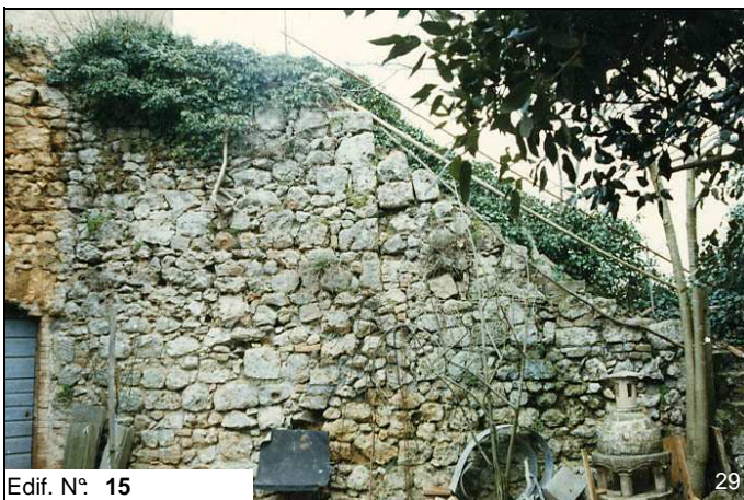
Edif. N° 15