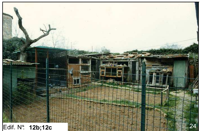
Edif. N° 12b;12c