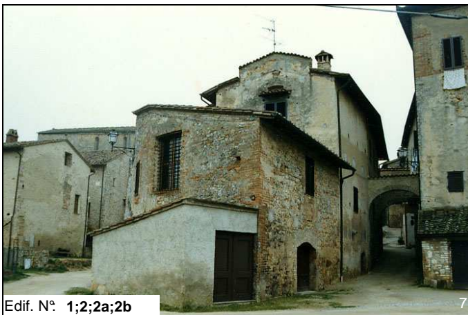
Edif. N° 1;2;2a;2b