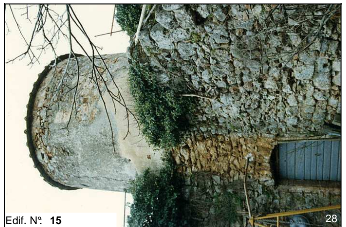
Edif. N° 15