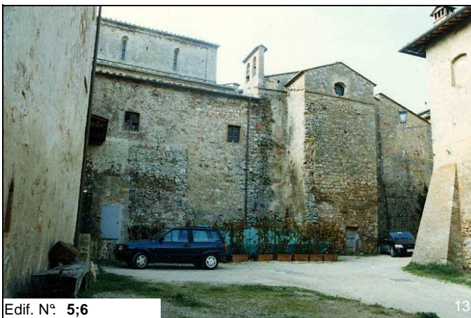
Edif. N° 5;6