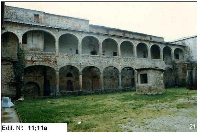
Edif. N° 11;11a