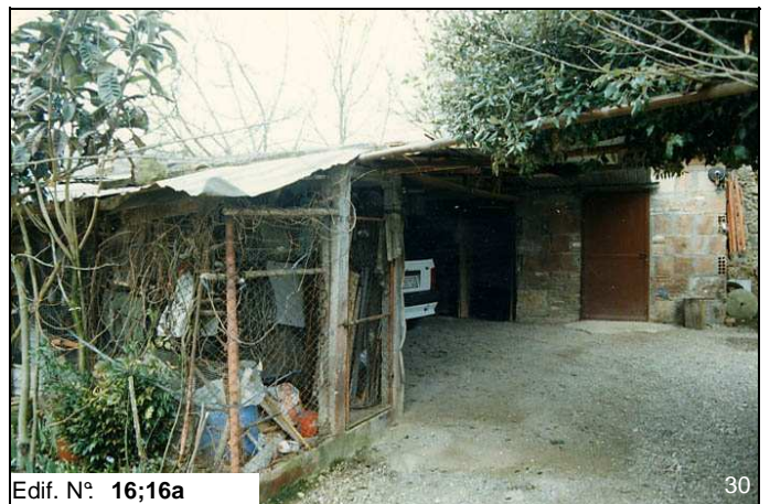
Edif. N° 16;16a