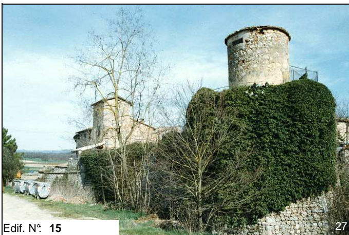
Edif. N° 15