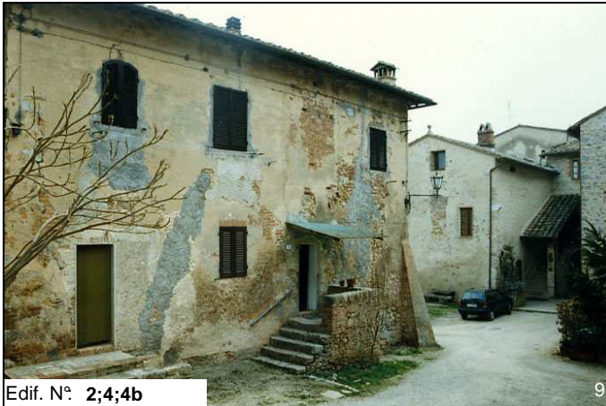
Edif. N° 2;4;4b