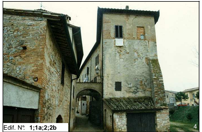
Edif. N° 1;1a;2;2b