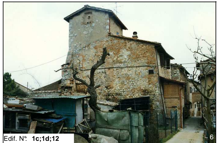
Edif. N° 1c;1d;12