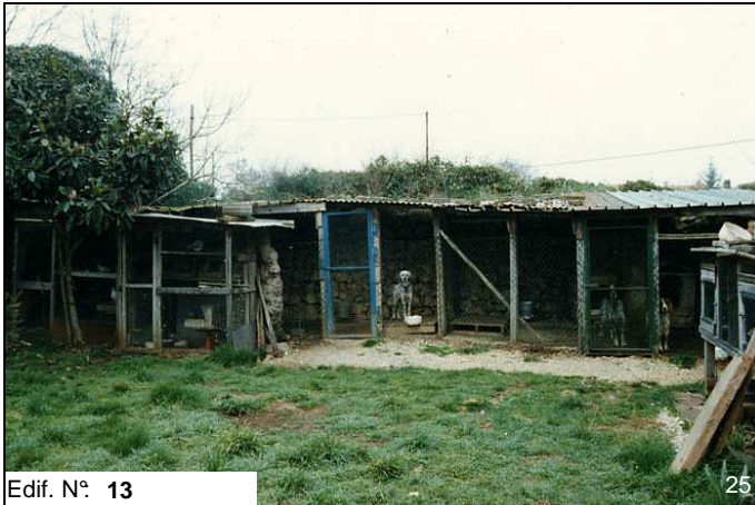
Edif. N° 13