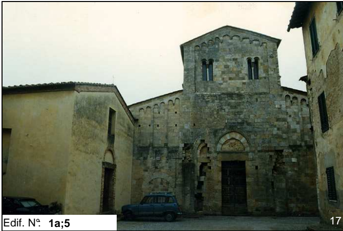
Edif. N° 1a;5