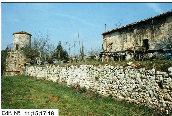
Edif. N° 11;15;17;18