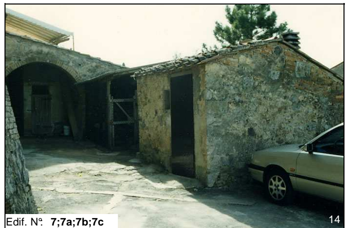
Edif. N° 7;7a;7b;7c