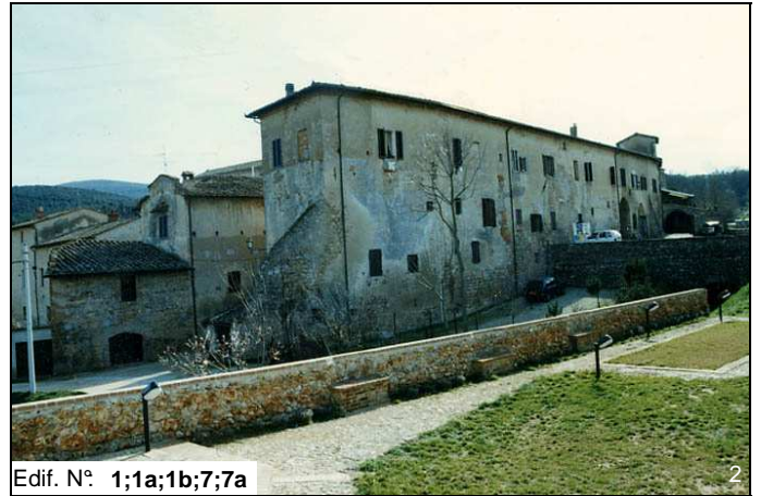
Edif. N° 1;1a;1b;7;7a