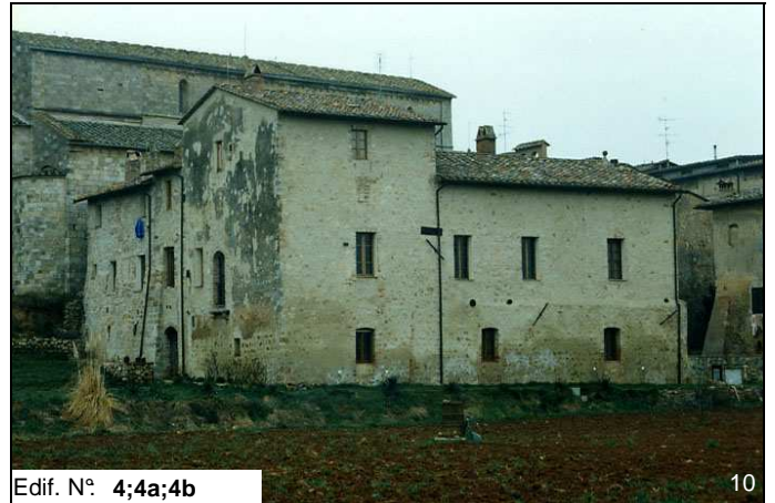
Edif. N° 4;4a;4b