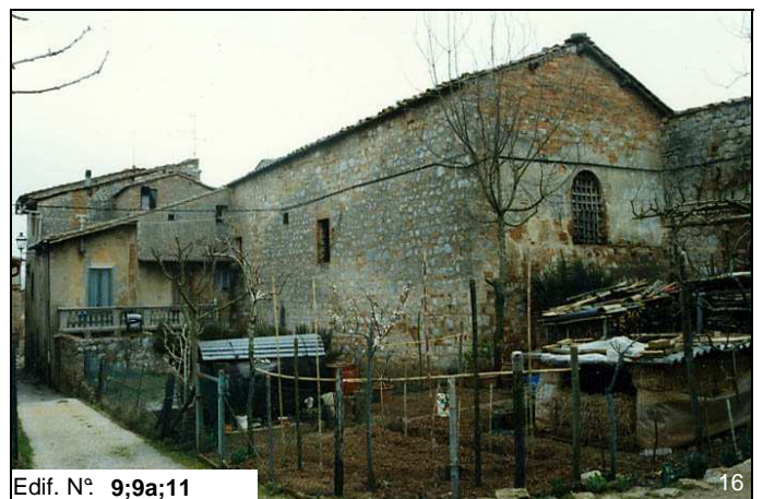
Edif. N° 9;9a;11