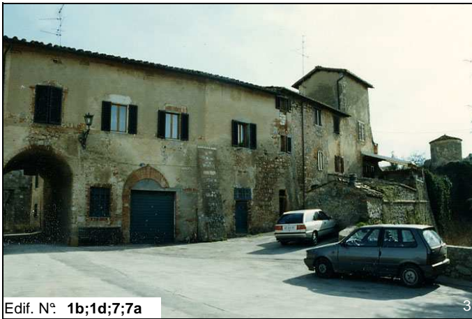
Edif. N° 1b;1d;7;7a