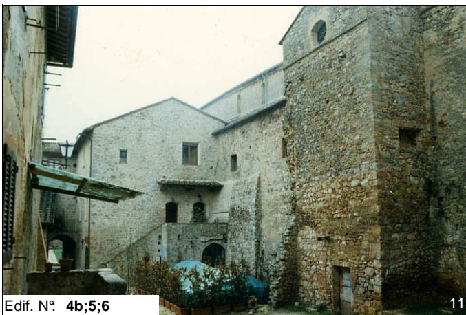
Edif. N° 4b;5;6