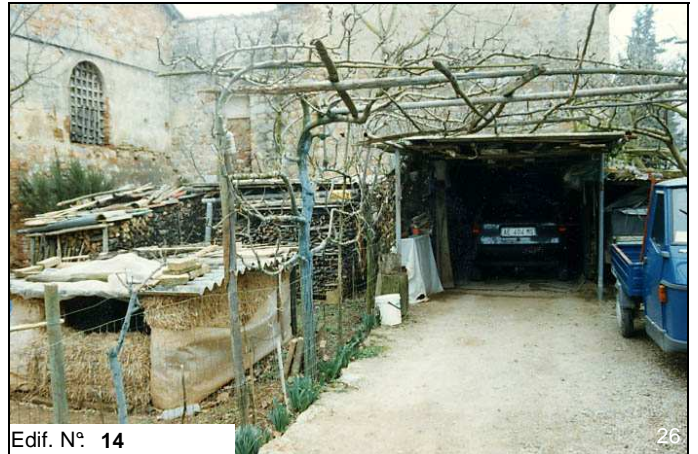
Edif. N° 14