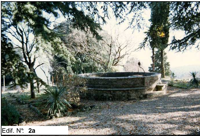
Edif. N° 2a