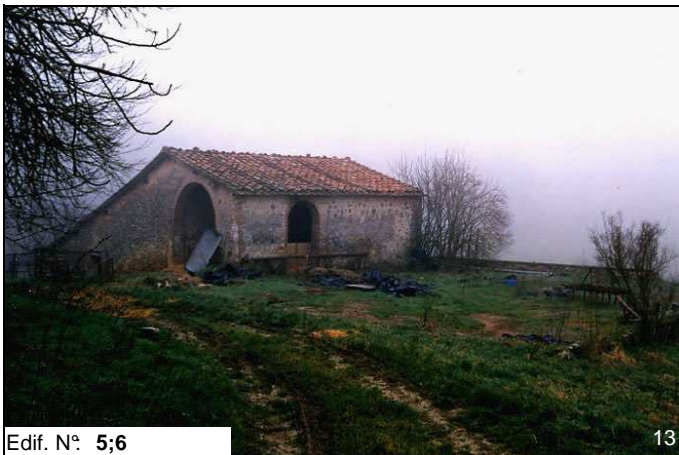
Edif. N° 5;6