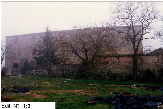
Edif. N° 1;3