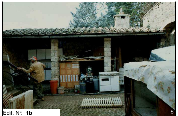
Edif. N° 1b