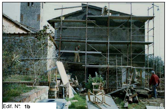
Edif. N° 1b