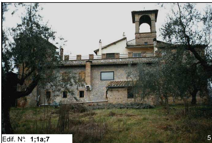
Edif. N° 1;1a;7