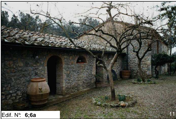
Edif. N° 6;6a