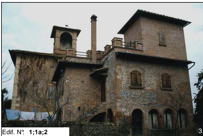
Edif. N° 1;1a;2