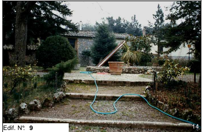
Edif. N° 9