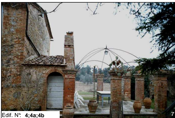
Edif. N° 4;4a;4b