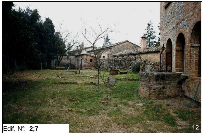
Edif. N° 2;7