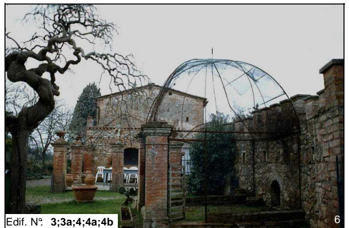
Edif. N° 3;3a;4;4a;4b