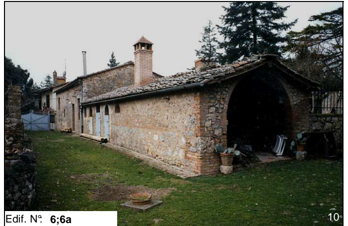
Edif. N° 6;6a