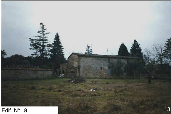
Edif. N° 8