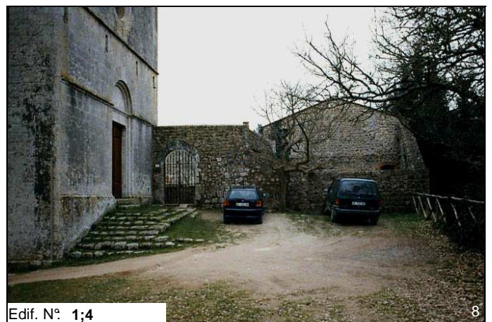
Edif. N° 1;4