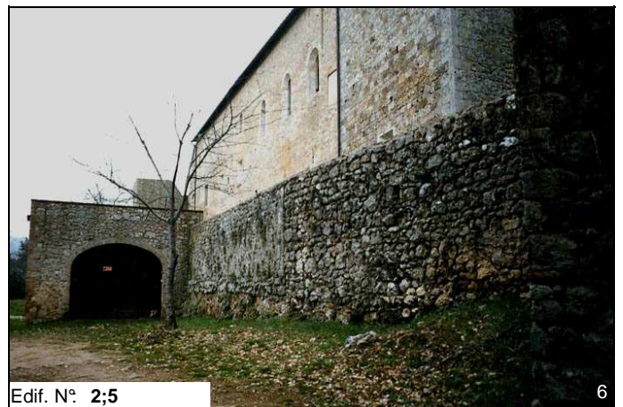
Edif. N° 2;5