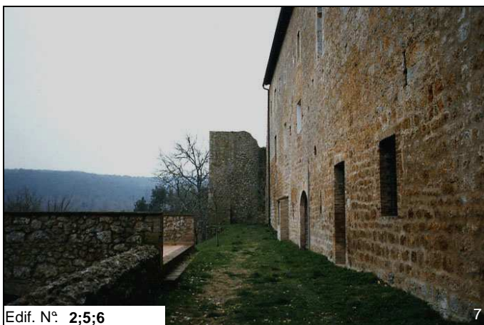
Edif. N° 2;5;6