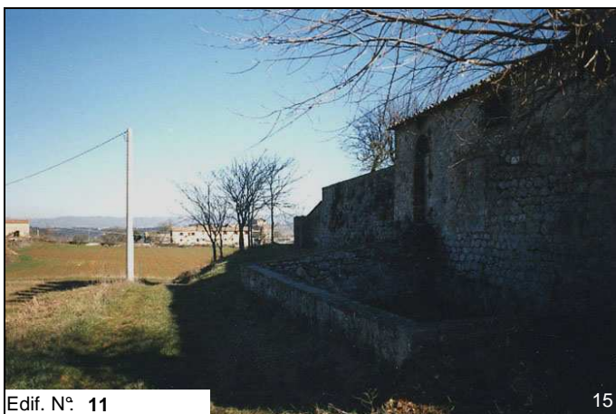
Edif. N° 11