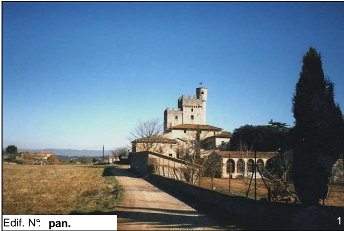
Edif. N° pan.