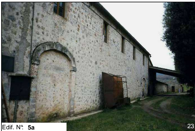
Edif. N° 5a