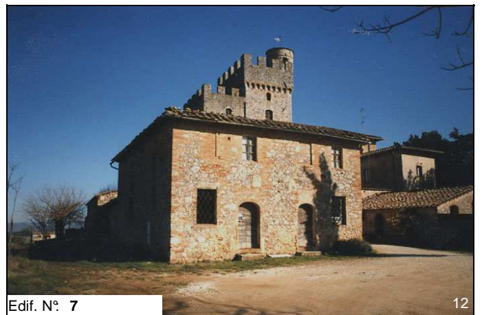
Edif. N° 7