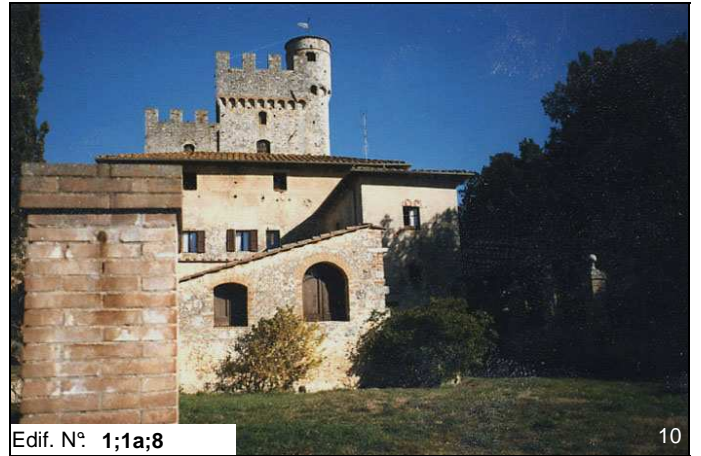
Edif. N° 1;1a;8