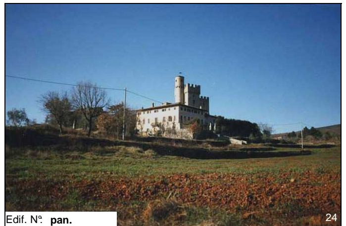
Edif. N° pan.