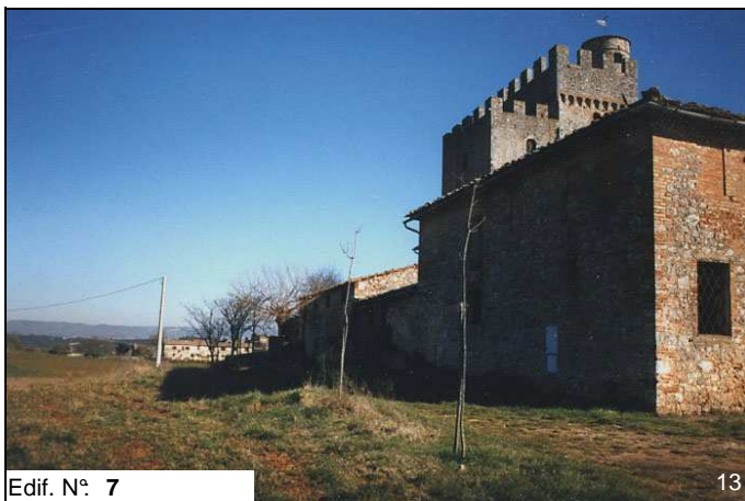
Edif. N° 7