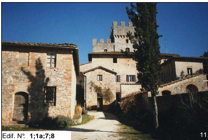
Edif. N° 1;1a;7;8