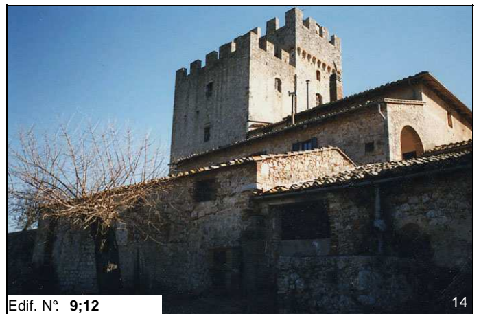
Edif. N° 9;12