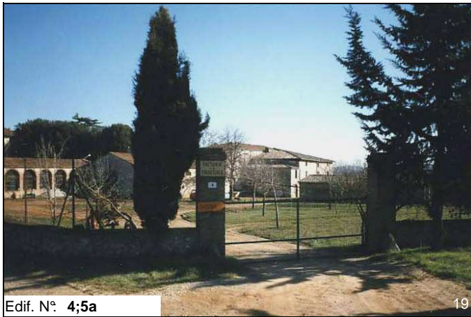
Edif. N° 4;5a