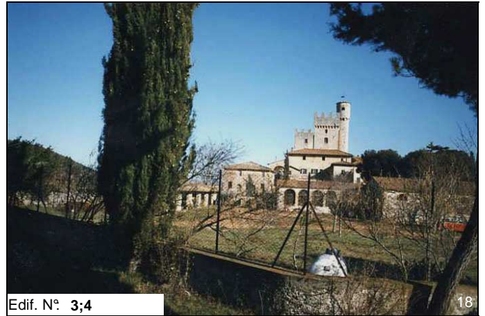
Edif. N° 3;4