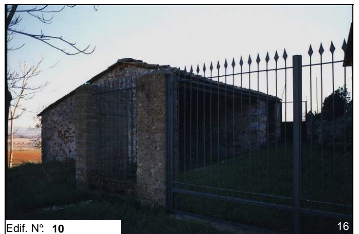
Edif. N° 10