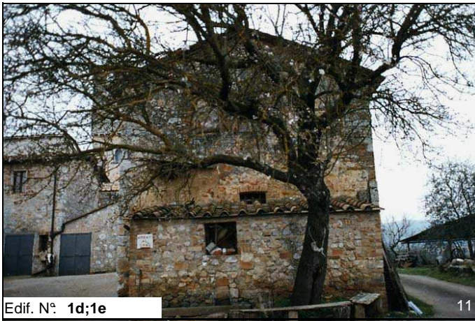
Edif. N° 1d;1e