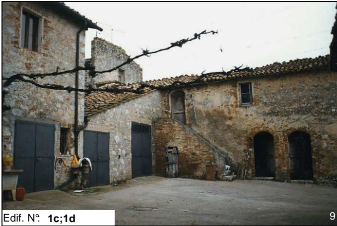
Edif. N° 1c;1d