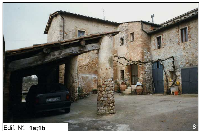
Edif. N° 1a;1b