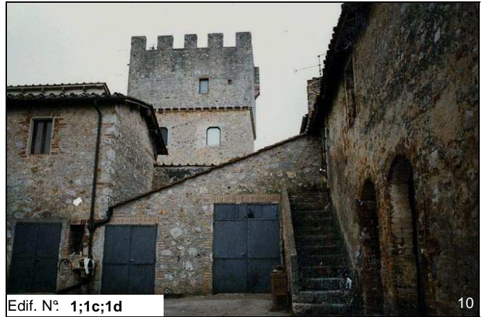
Edif. N° 1;1c;1d