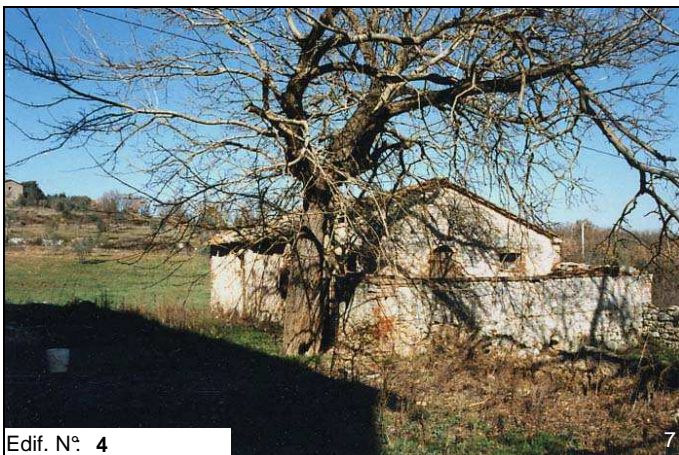
Edif. N° 4