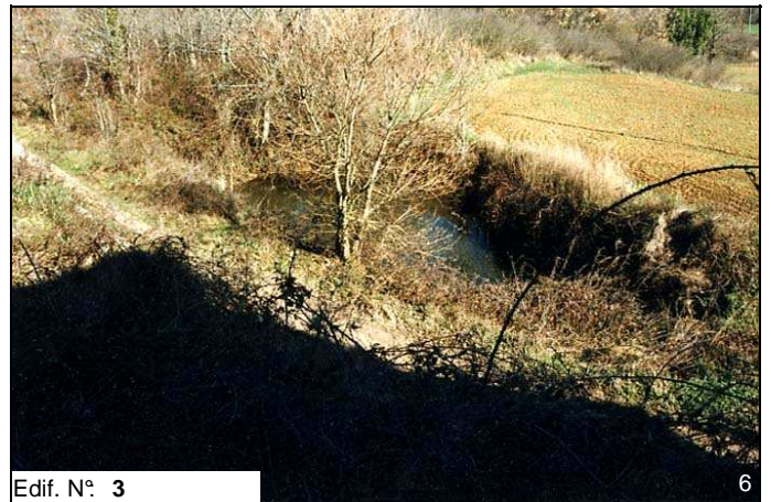
Edif. N° 3