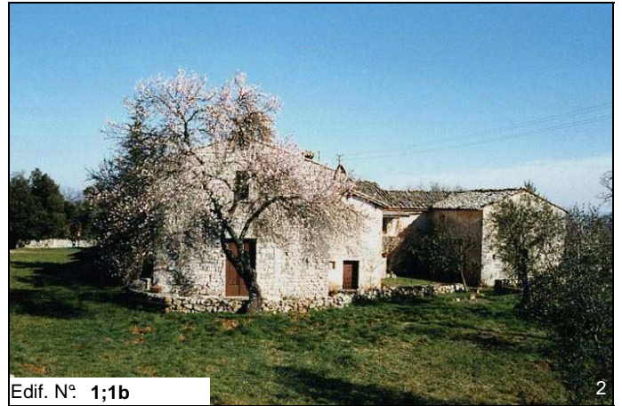
Edif. N° 1;1b