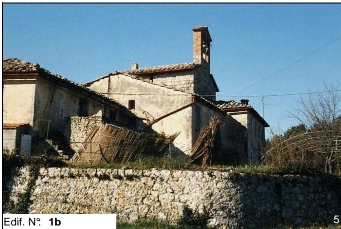
Edif. N° 1b