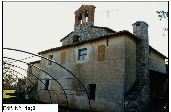
Edif. N° 1a;2