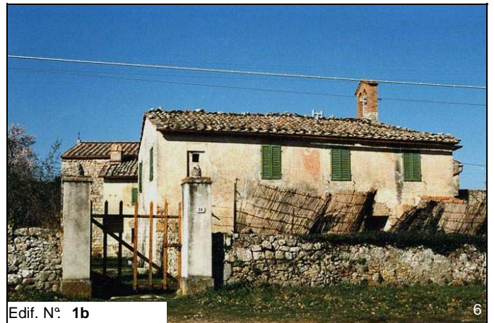
Edif. N° 1b