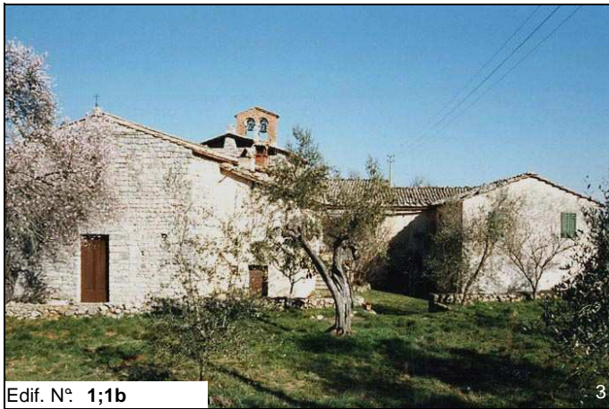
Edif. N° 1;1b