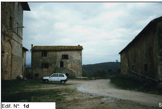
Edif. N° 1d