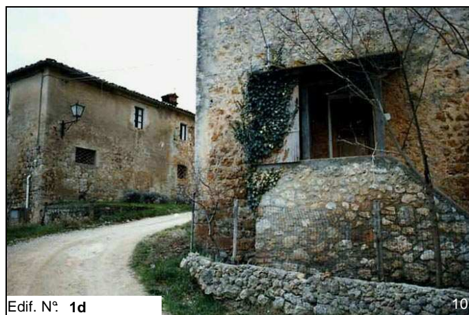
Edif. N° 1d