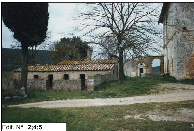
Edif. N° 2;4;5