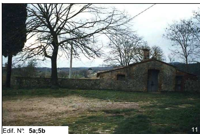
Edif. N° 5a;5b