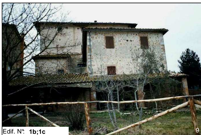
Edif. N° 1b;1c