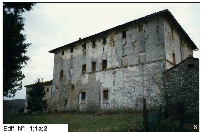
Edif. N° 1;1a;2