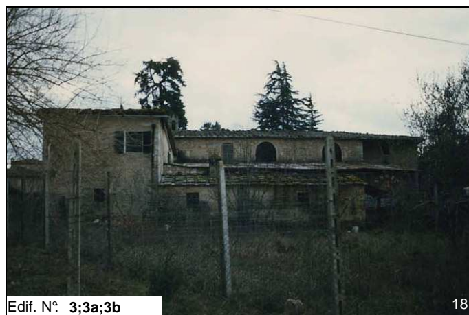
Edif. N° 3;3a;3b