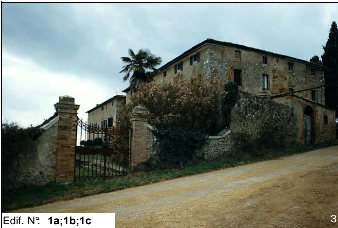
Edif. N° 1a;1b;1c