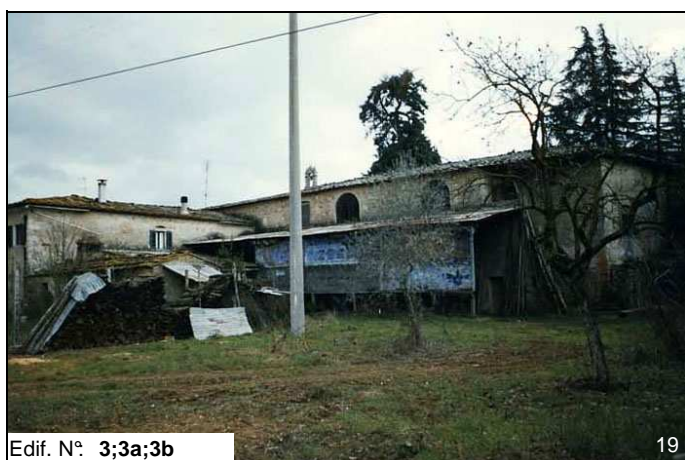
Edif. N° 3;3a;3b