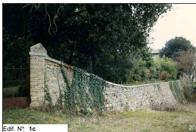
Edif. N° 1c