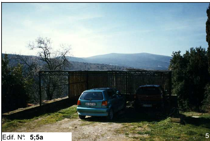
Edif. N° 5;5a