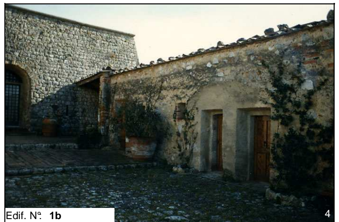
Edif. N° 1b