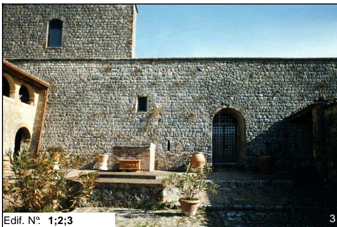
Edif. N° 1;2;3