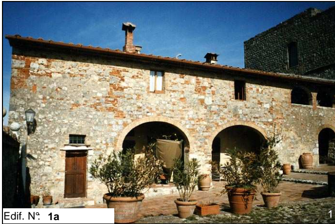
Edif. N° 1a