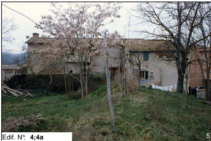
Edif. N° 4;4a