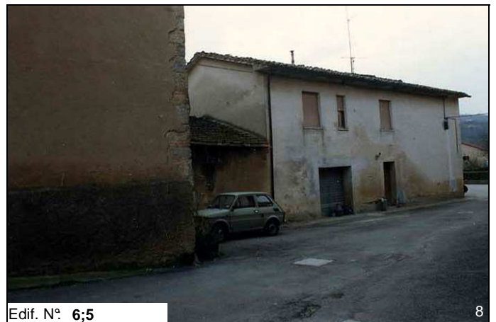
Edif. N° 6;5