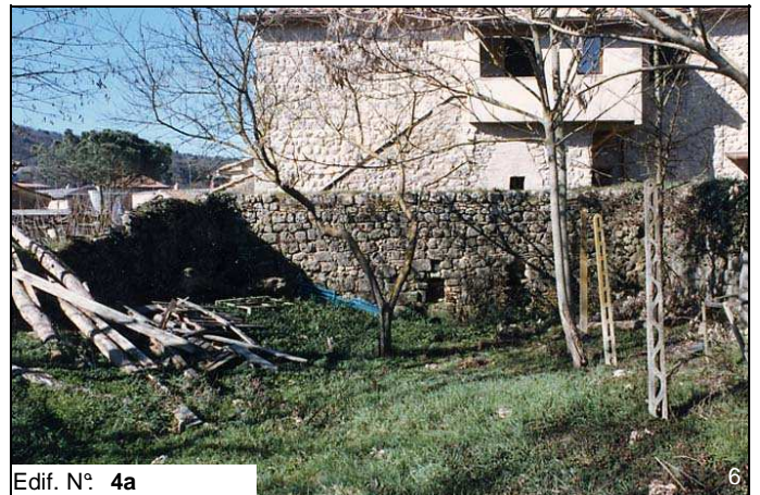
Edif. N° 4a