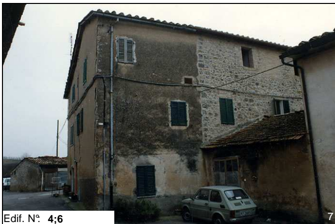
Edif. N° 4;6