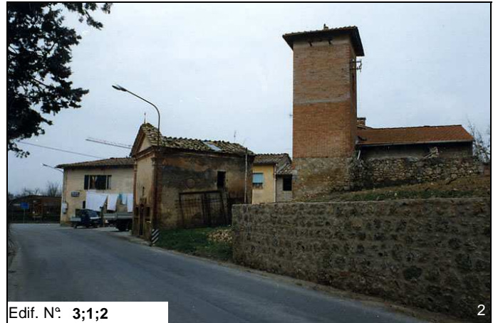
Edif. N° 3;1;2