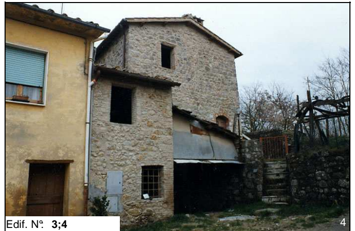
Edif. N° 3;4