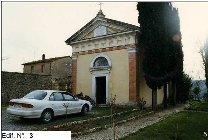
Edif. N° 3