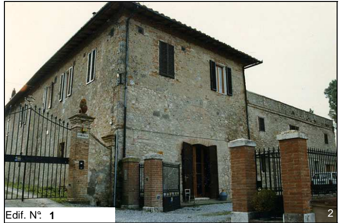
Edif. N° 1