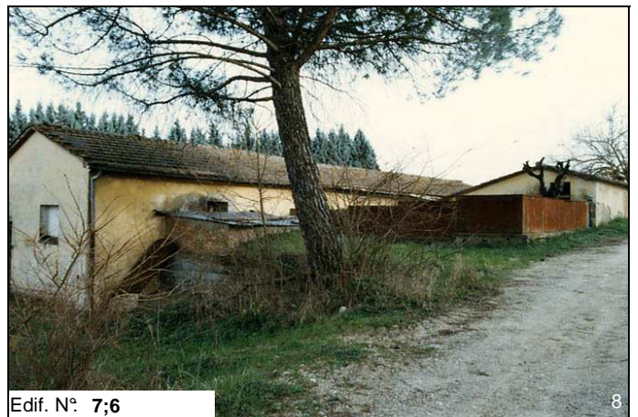
Edif. N° 7;6