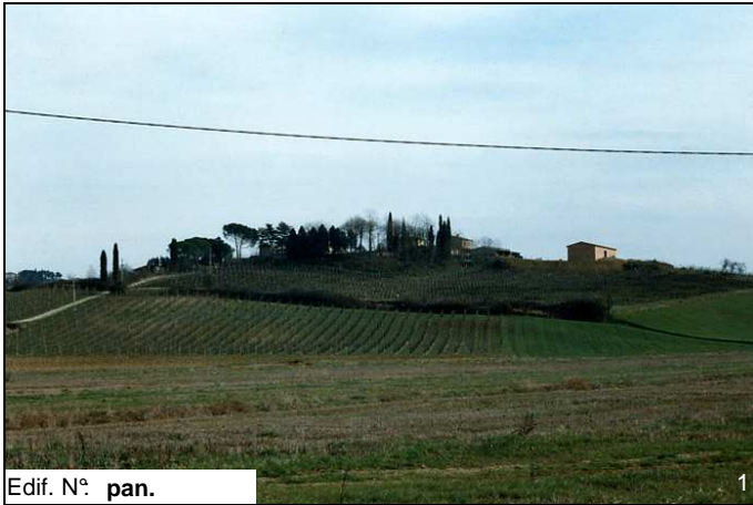
Edif. N° pan.