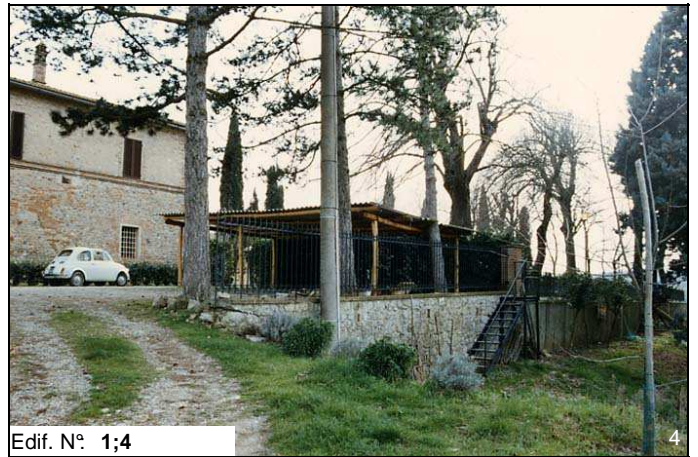
Edif. N° 1;4