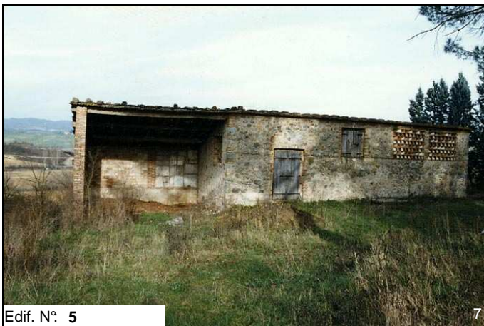
Edif. N° 5