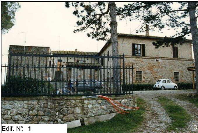
Edif. N° 1