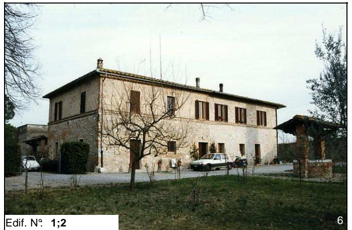
Edif. N° 1;2