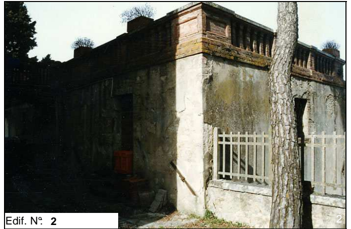
Edif. N° 2