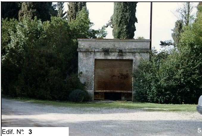
Edif. N° 3