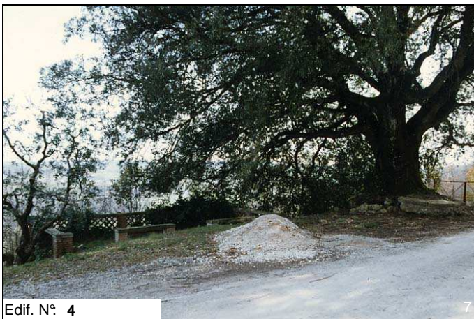
Edif. N° 4