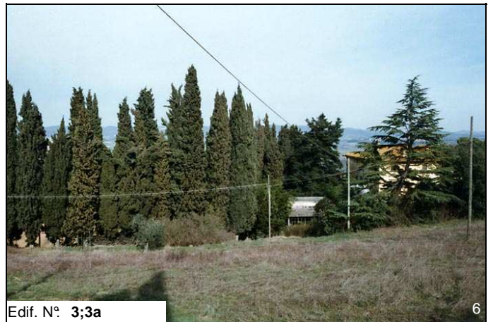
Edif. N° 3;3a