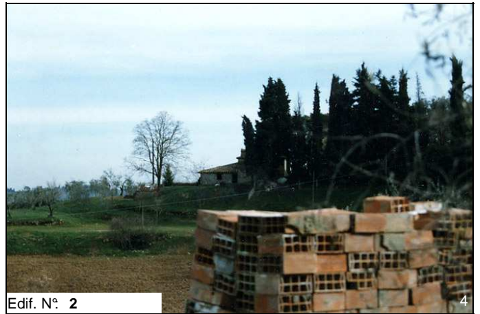
Edif. N° 2