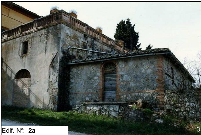
Edif. N° 2a