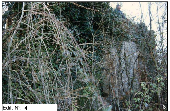
Edif. N° 4