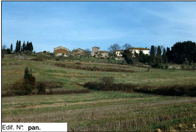
Edif. N° pan.