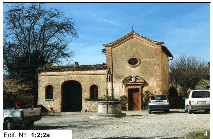
Edif. N° 1;2;2a