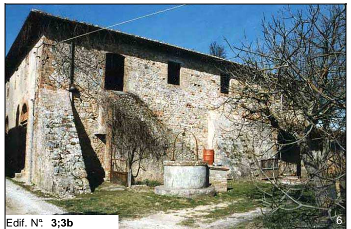
Edif. N° 3;3b