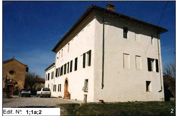
Edif. N° 1;1a;2