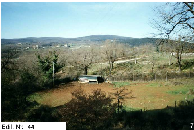
Edif. N° 44