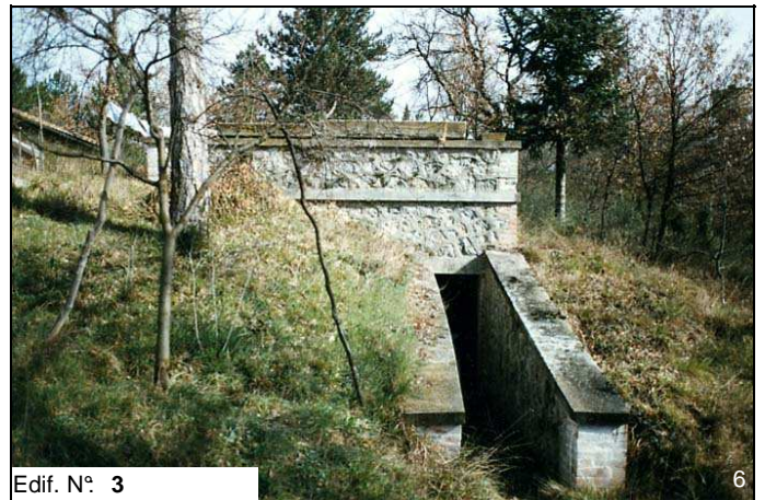
Edif. N° 3