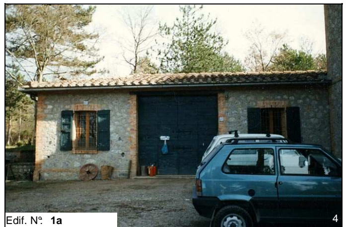
Edif. N° 1a