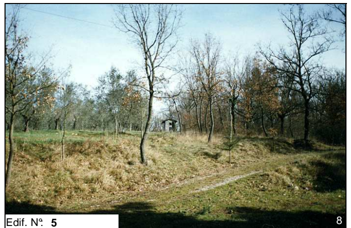
Edif. N° 5