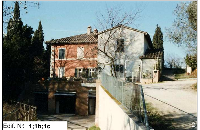
Edif. N° 1;1b;1c