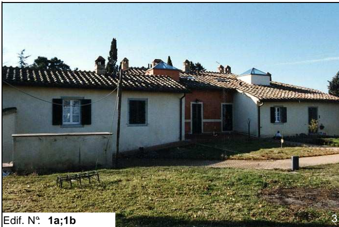
Edif. N° 1a;1b