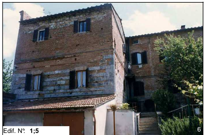
Edif. N° 1;5