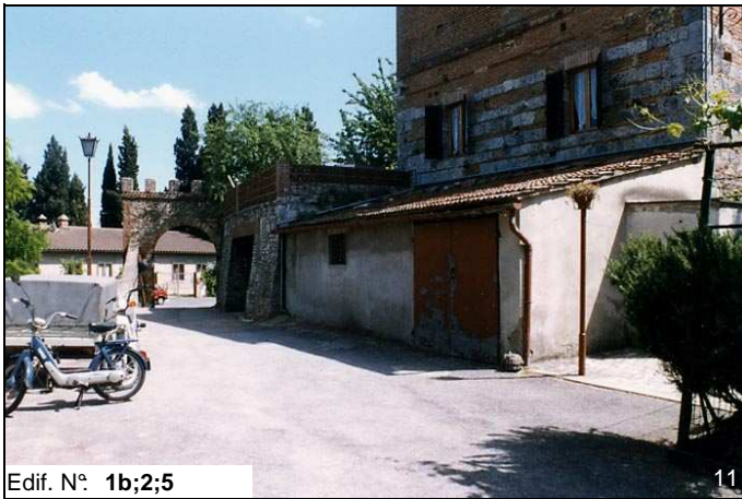
Edif. N° 1b;2;5