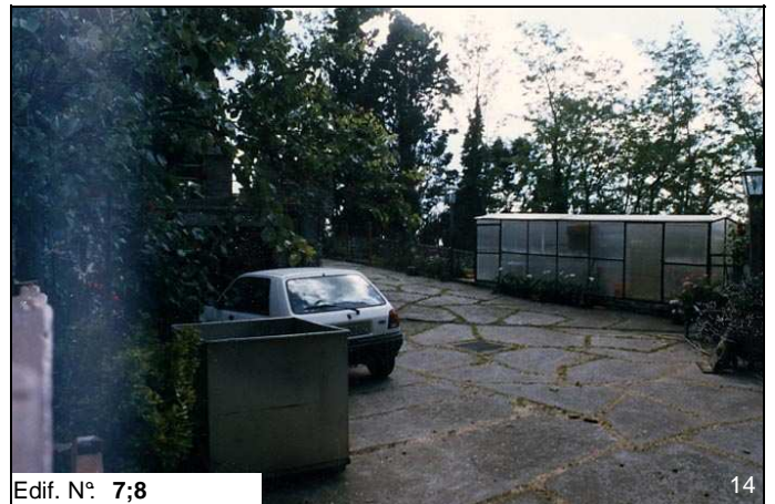
Edif. N° 7;8