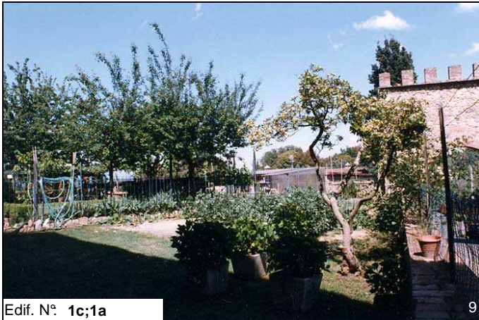
Edif. N° 1c;1a