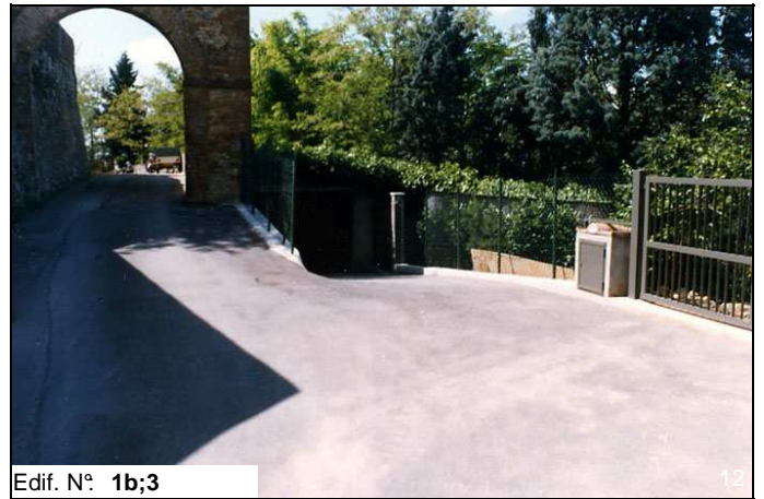
Edif. N° 1b;3