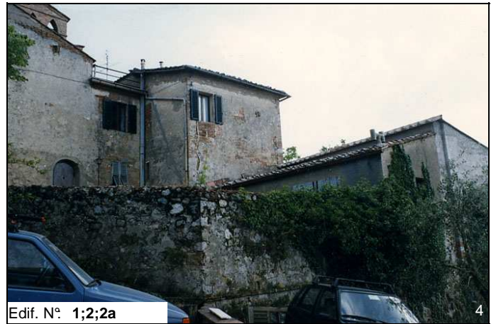
Edif. N° 1;2;2a