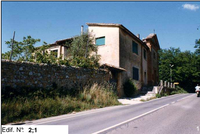
Edif. N° 2;1