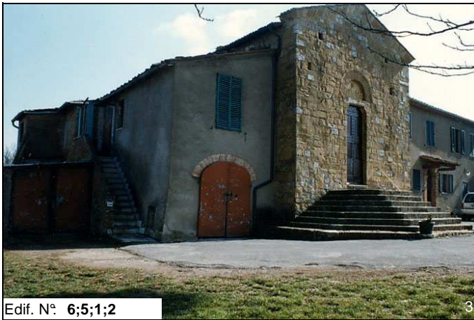
Edif. N° 6;5;1;2