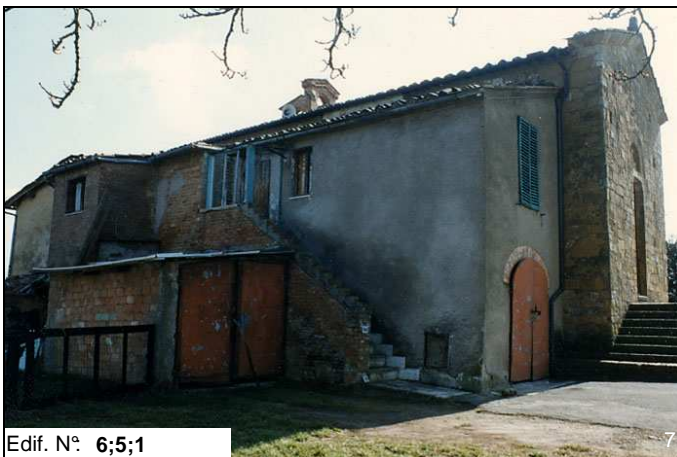
Edif. N° 6;5;1