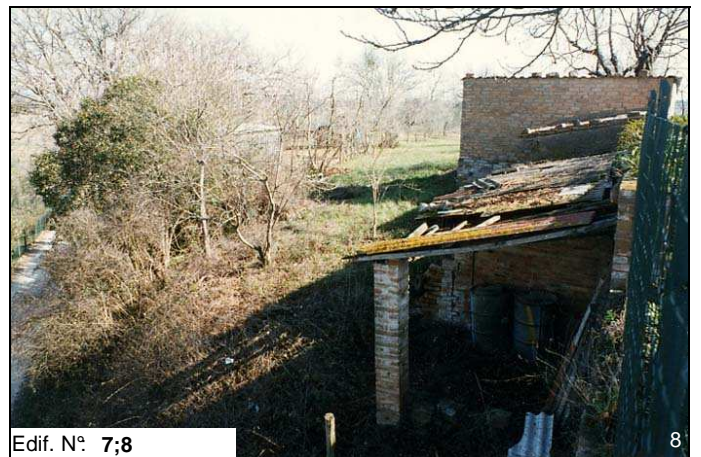
Edif. N° 7;8