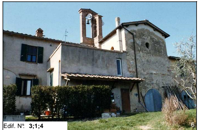
Edif. N° 3;1;4