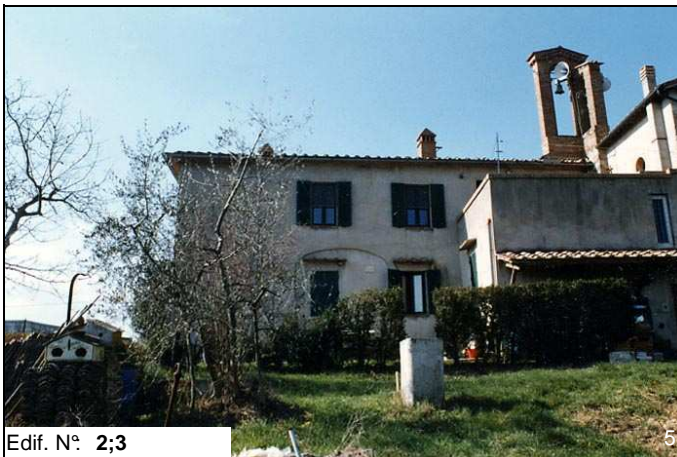
Edif. N° 2;3