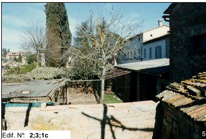
Edif. N° 2;3;1c