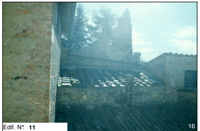
Edif. N° 11