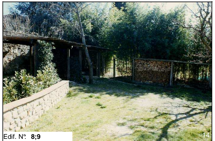
Edif. N° 8;9