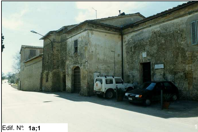
Edif. N° 1a;1