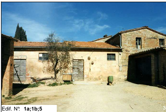
Edif. N° 1a;1b;5