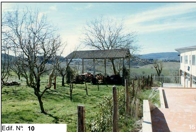
Edif. N° 10