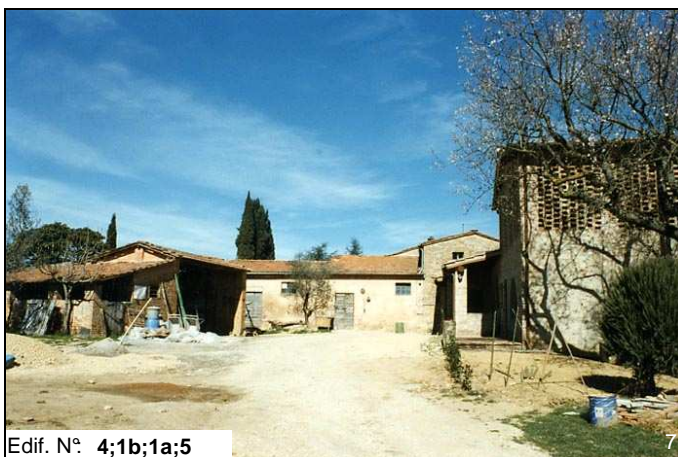
Edif. N° 4;1b;1a;5