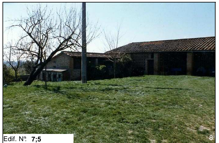
Edif. N° 7;5