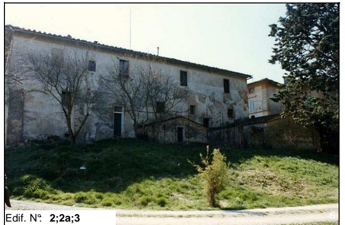
Edif. N° 2;2a;3