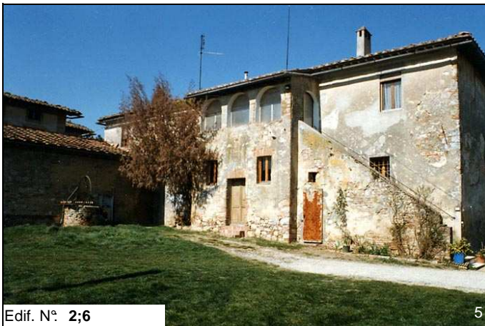
Edif. N° 2;6