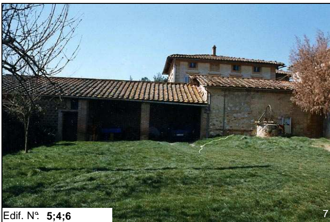
Edif. N° 5;4;6