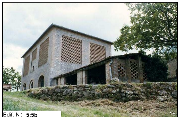
Edif. N° 5;5b