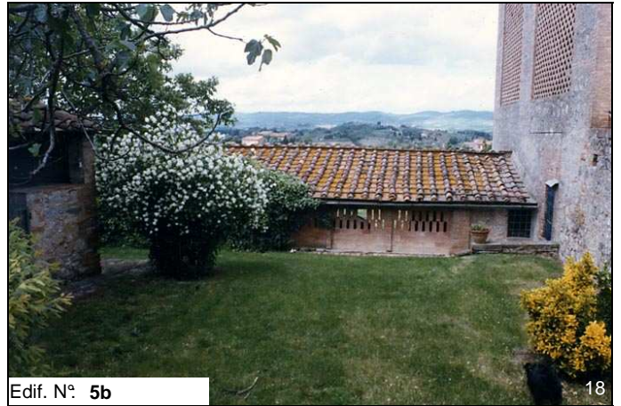
Edif. N° 5b