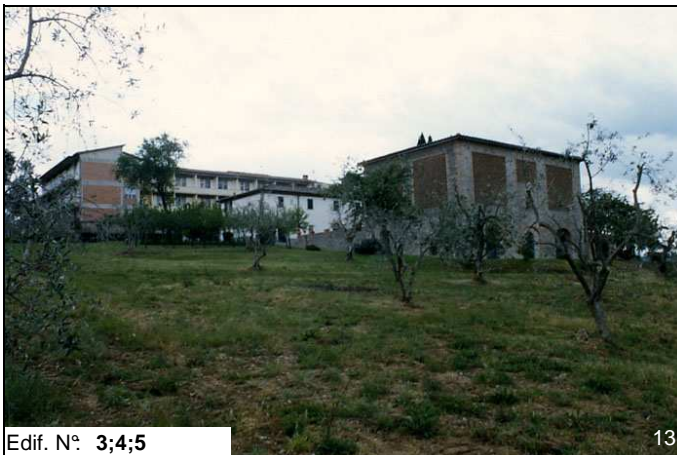
Edif. N° 3;4;5