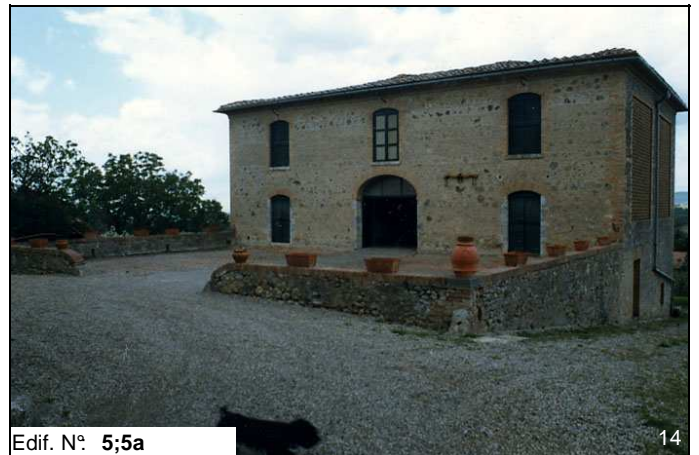
Edif. N° 5;5a