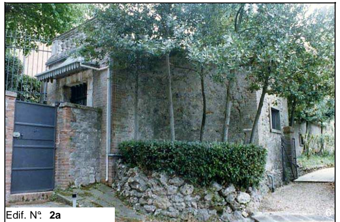
Edif. N° 2a