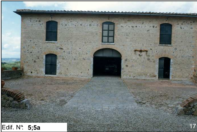
Edif. N° 5;5a