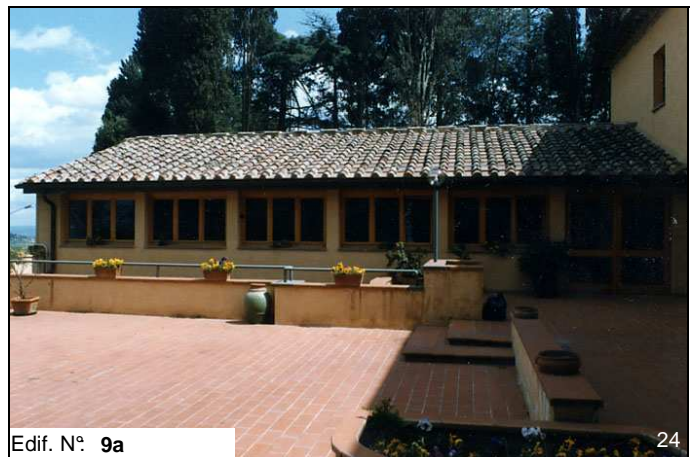
Edif. N° 9a