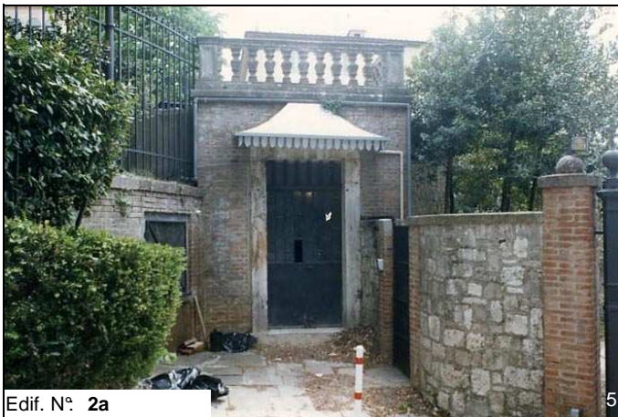
Edif. N° 2a