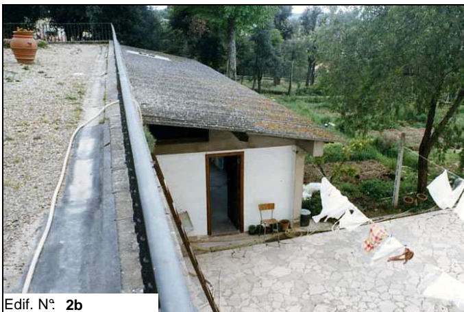
Edif. N° 2b