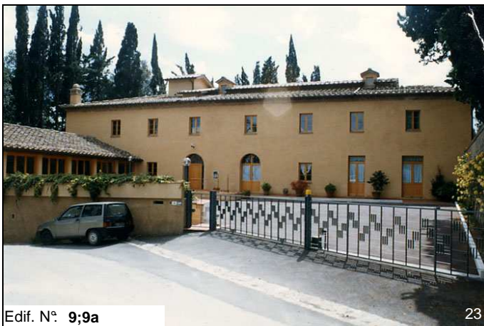
Edif. N° 9;9a