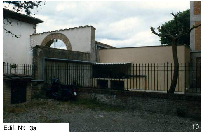
Edif. N° 3a