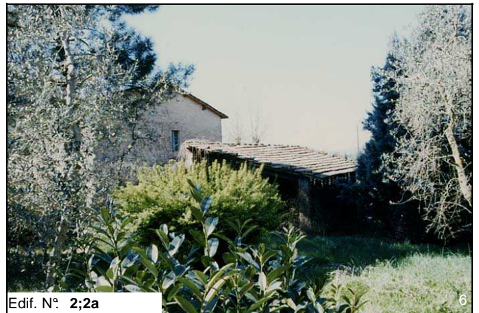
Edif. N° 2;2a