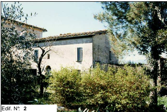
Edif. N° 2