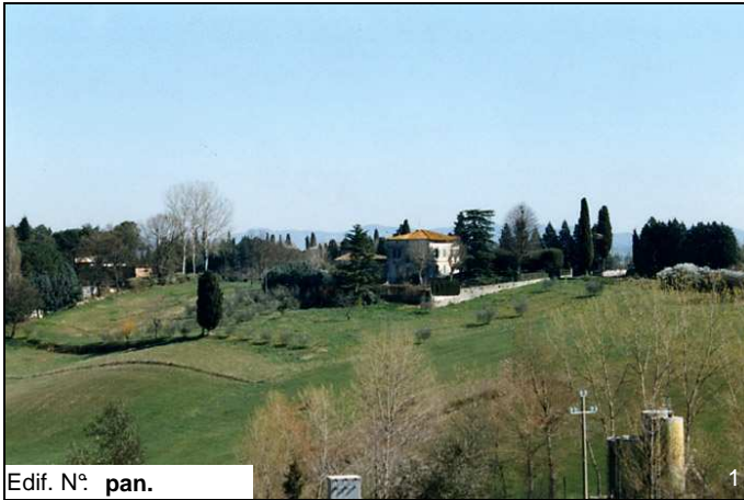
Edif. N° pan.