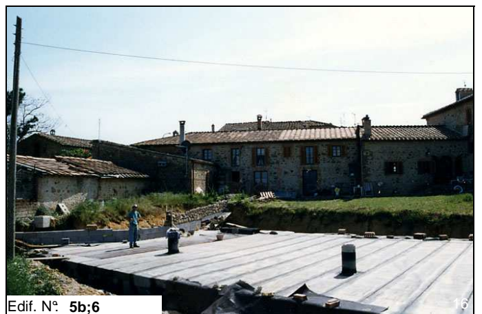
Edif. N° 5b;6