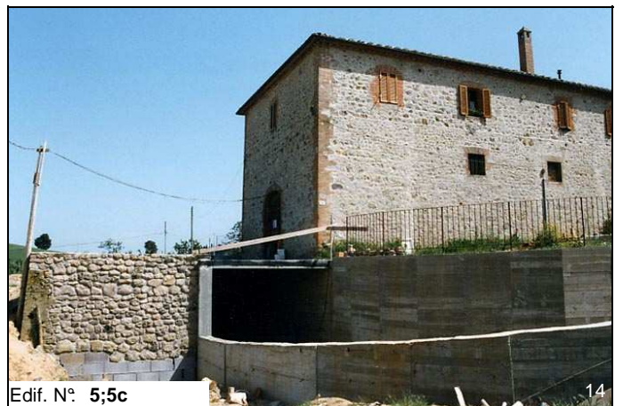
Edif. N° 5;5c