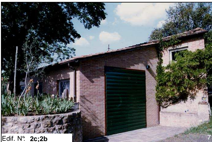
Edif. N° 2c;2b