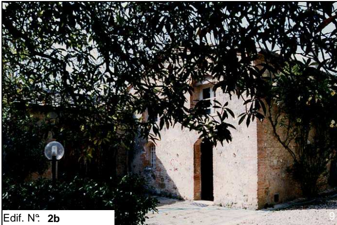
Edif. N° 2b