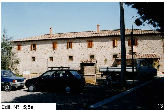
Edif. N° 5;5a