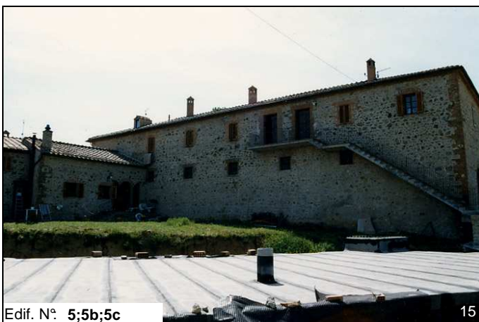
Edif. N° 5;5b;5c