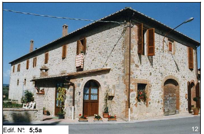
Edif. N° 5;5a