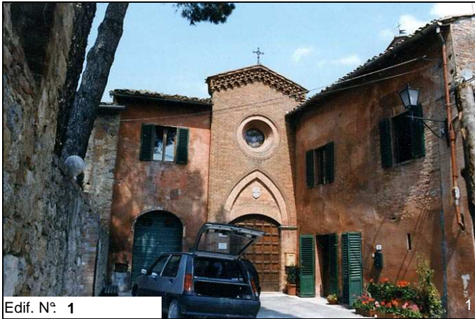
Edif. N° 1