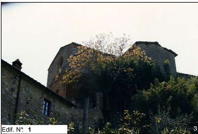
Edif. N° 1