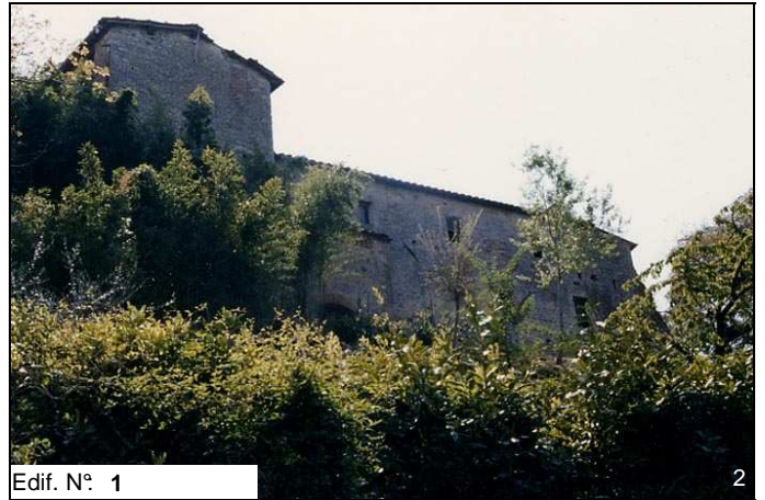
Edif. N° 1