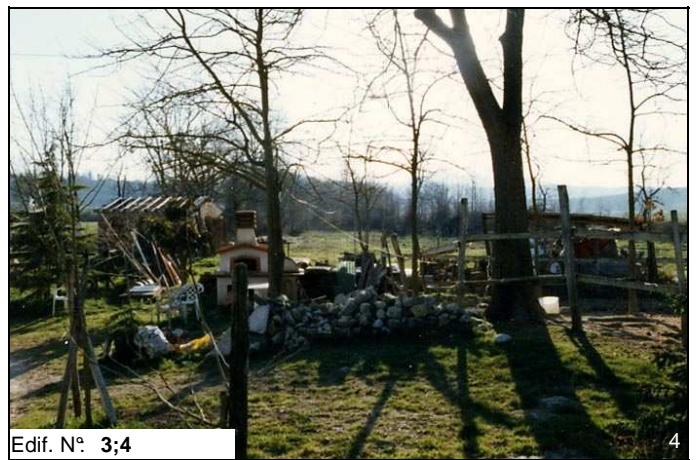
Edif. N° 3;4