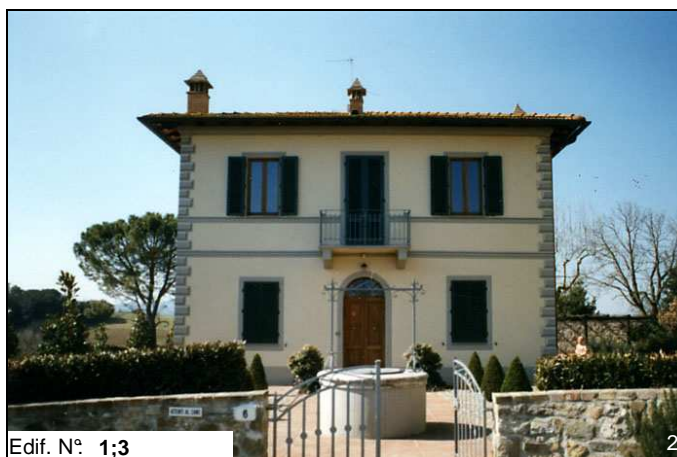
Edif. N° 1;3