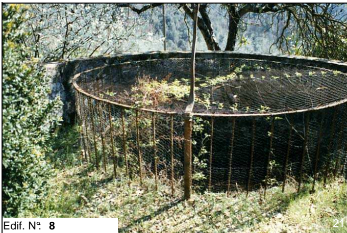
Edif. N° 8