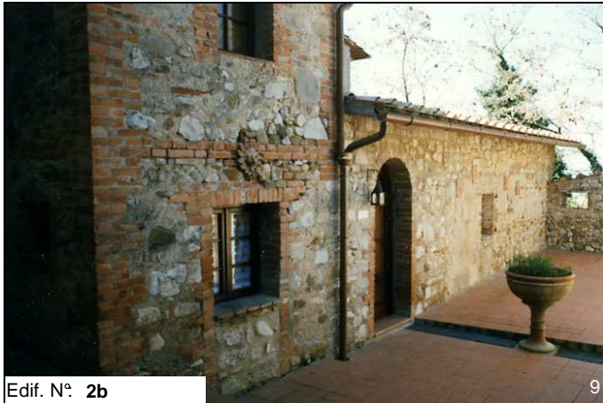
Edif. N° 2b