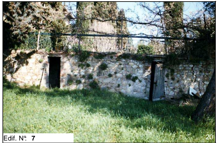
Edif. N° 7