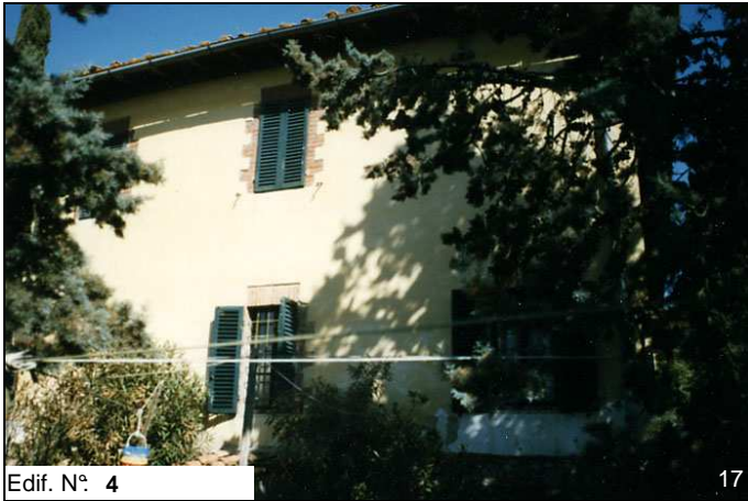
Edif. N° 4