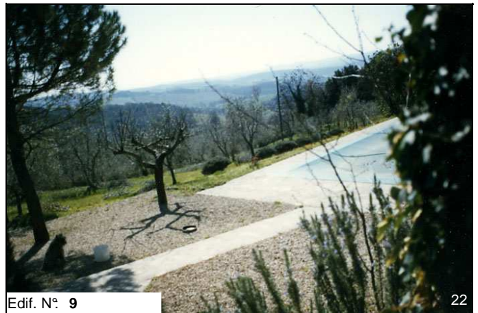
Edif. N° 9