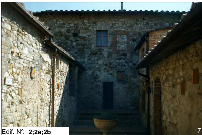
Edif. N° 2;2a;2b