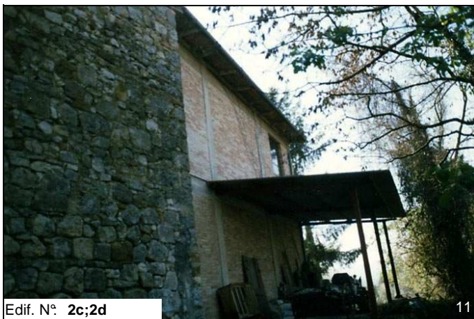
Edif. N° 2c;2d