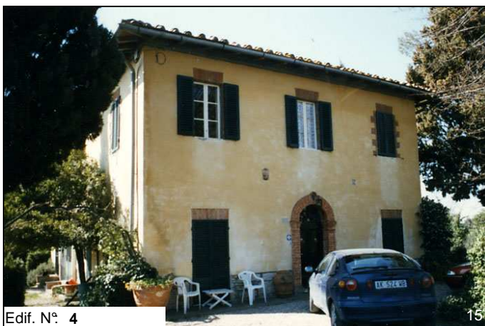
Edif. N° 4