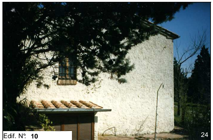
Edif. N° 10