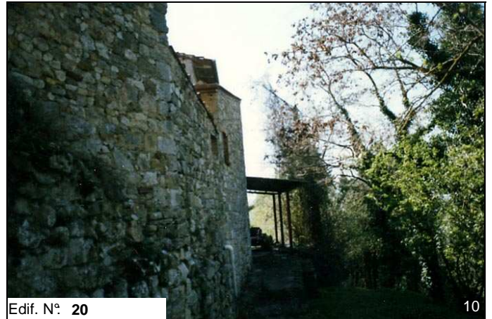
Edif. N° 20