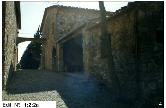
Edif. N° 1;2;2a