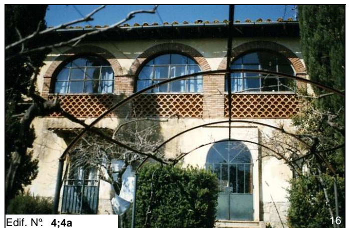
Edif. N° 4;4a