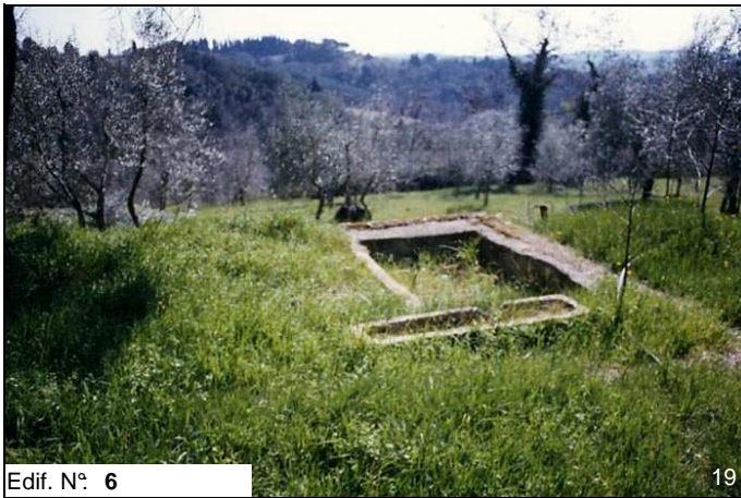
Edif. N° 6