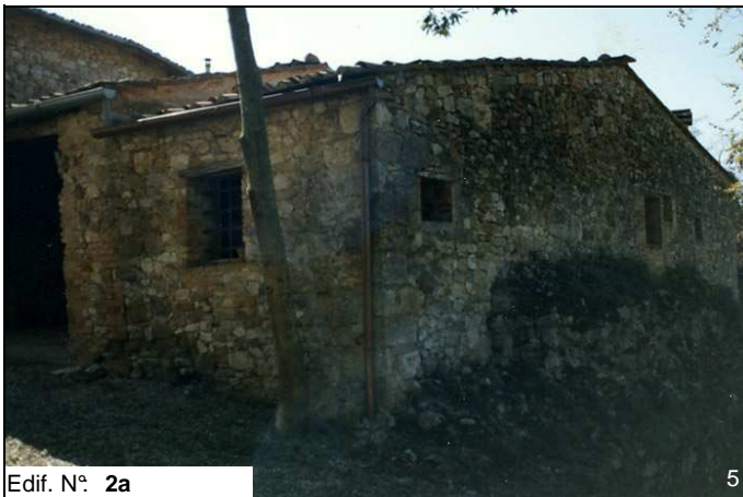
Edif. N° 2a