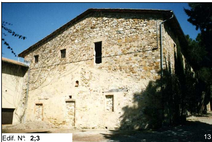
Edif. N° 2;3