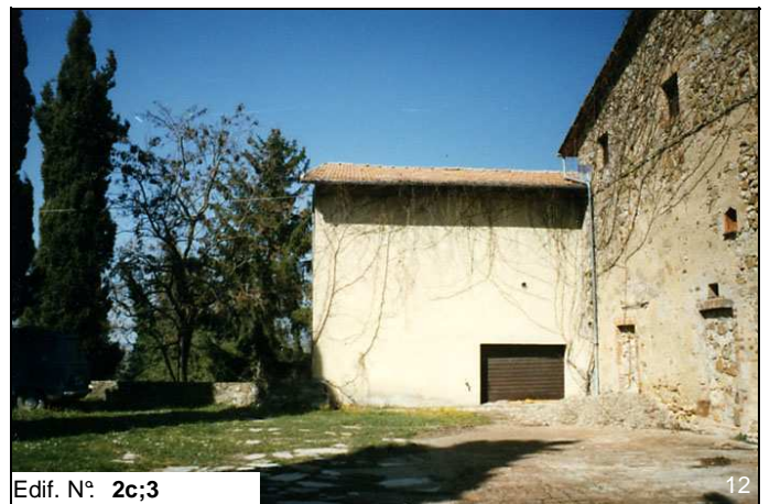
Edif. N° 2c;3