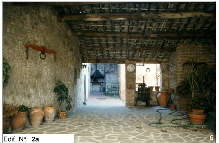
Edif. N° 2a