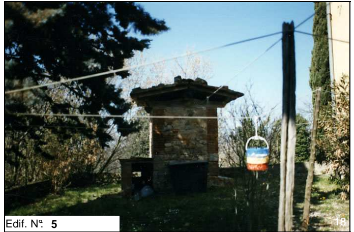
Edif. N° 5