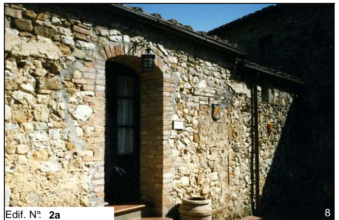
Edif. N° 2a