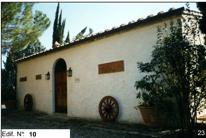
Edif. N° 10