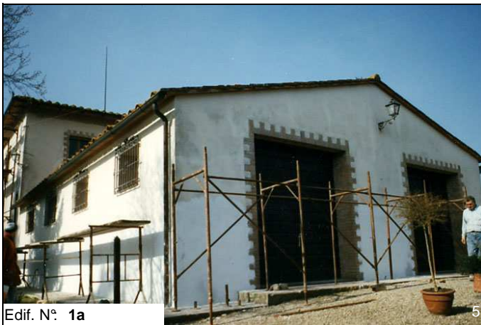
Edif. N° 1a