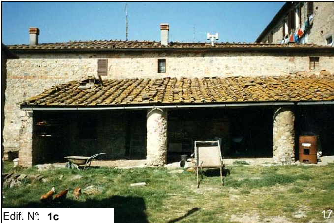
Edif. N° 1c