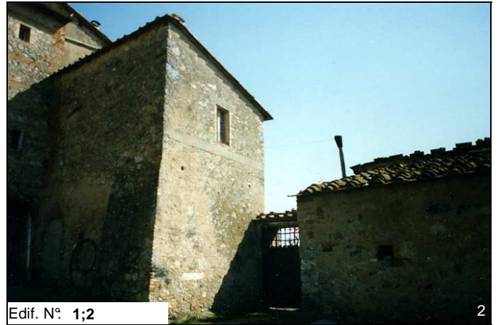
Edif. N° 1;2