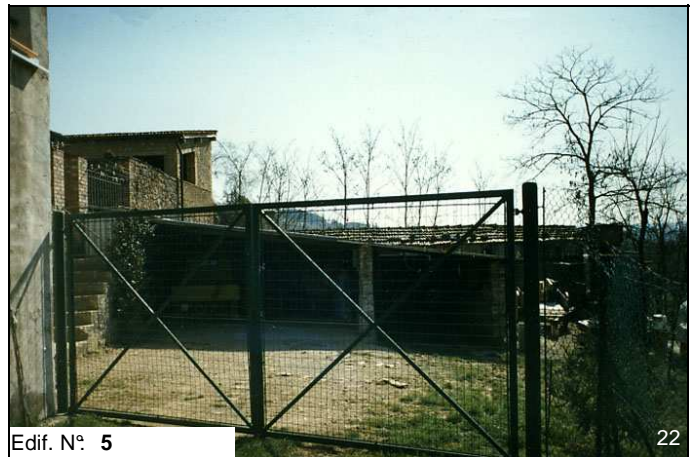
Edif. N° 5