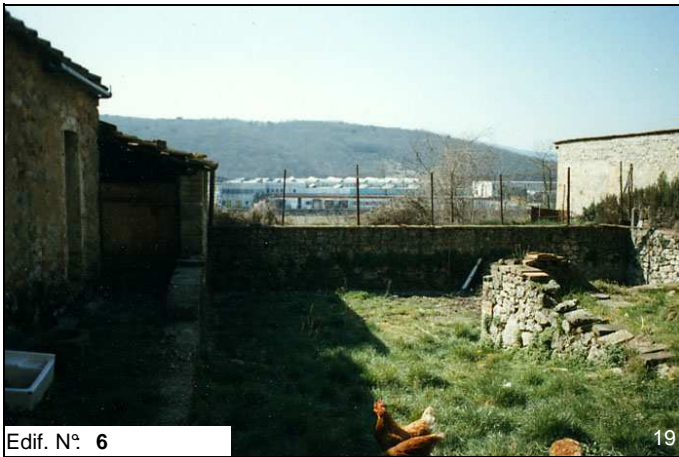
Edif. N° 6