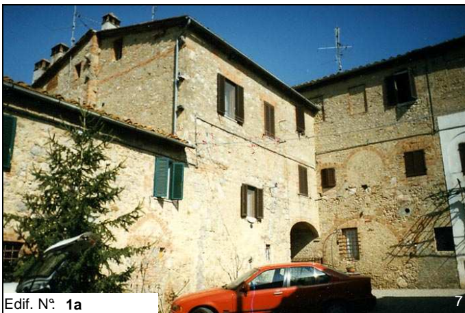
Edif. N° 1a