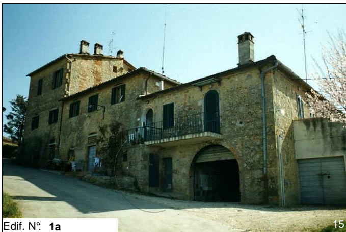
Edif. N° 1a