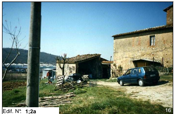
Edif. N° 1;2a