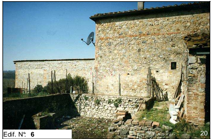
Edif. N° 6