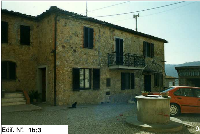
Edif. N° 1b;3