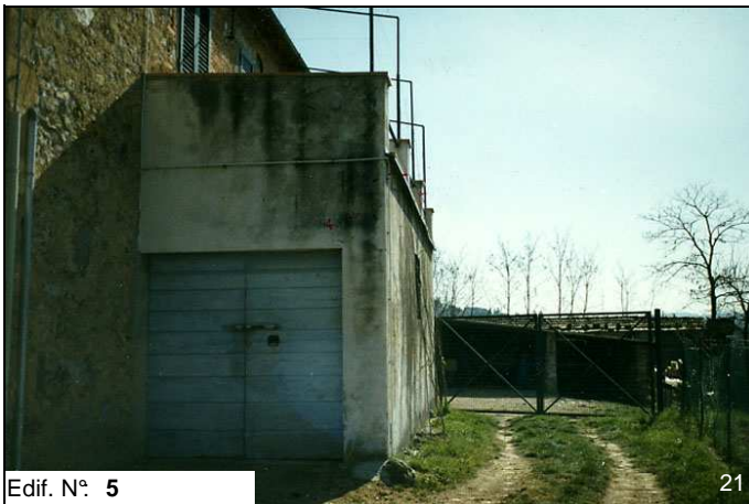
Edif. N° 5