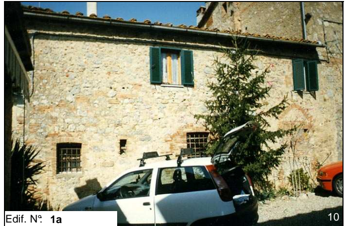
Edif. N° 1a