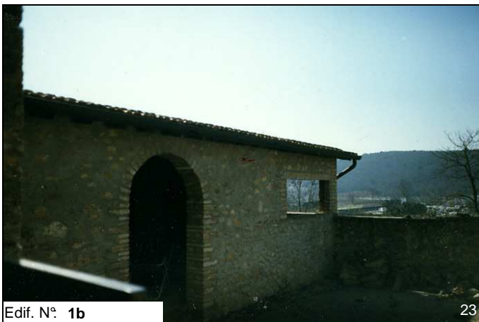
Edif. N° 1b