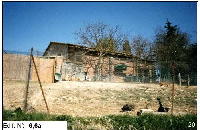
Edif. N° 6;6a