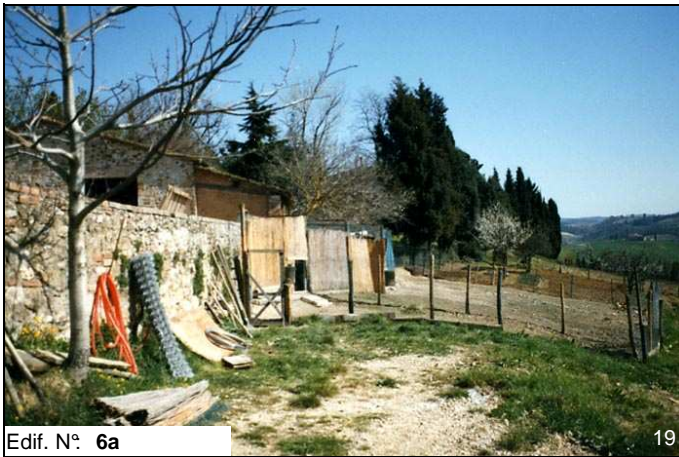
Edif. N° 6a