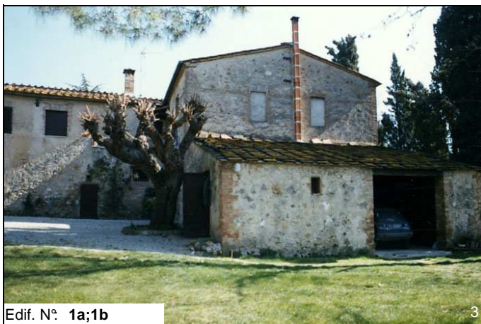
Edif. N° 1a;1b