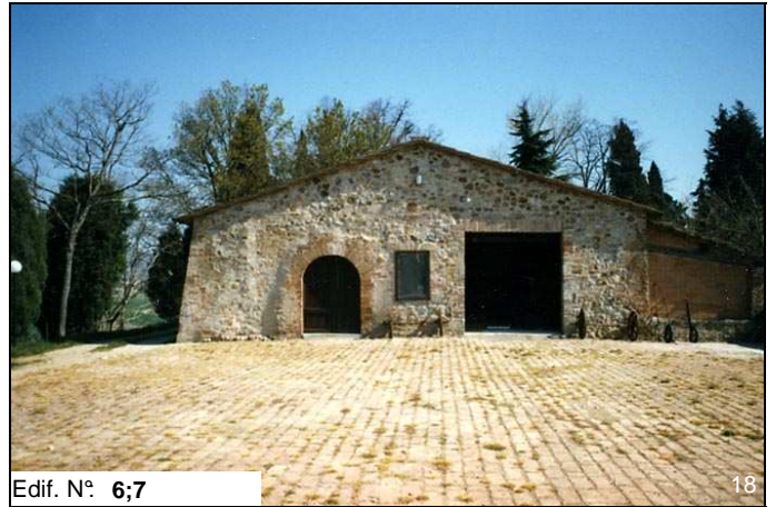
Edif. N° 6;7