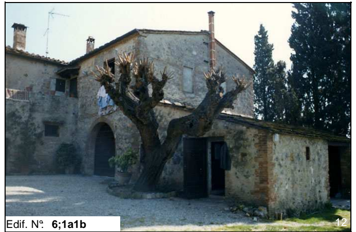
Edif. N° 6;1a1b