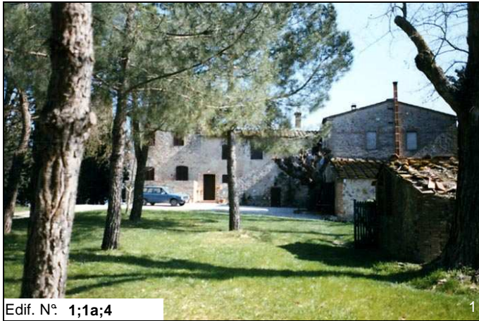
Edif. N° 1;1a;4