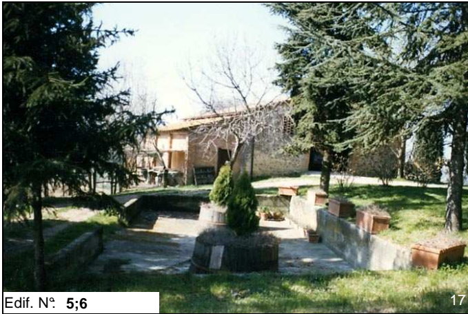
Edif. N° 5;6