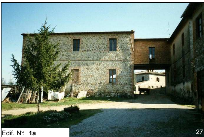
Edif. N° 1a