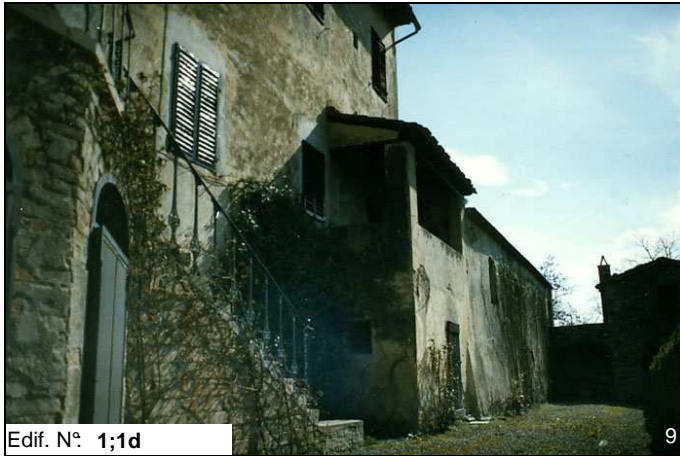
Edif. N° 1;1d