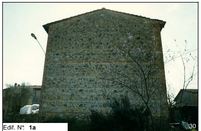
Edif. N° 1a