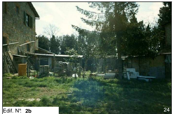
Edif. N° 2b