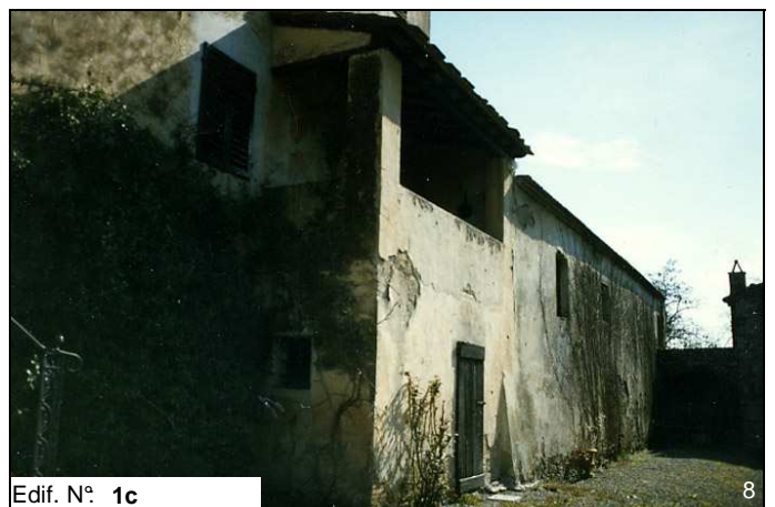
Edif. N° 1c