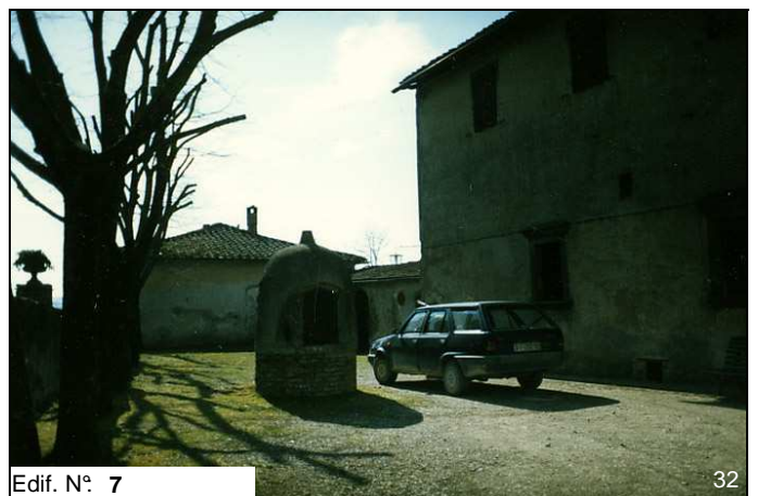
Edif. N° 7