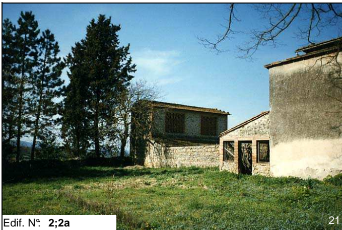
Edif. N° 2;2a