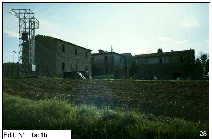
Edif. N° 1a;1b