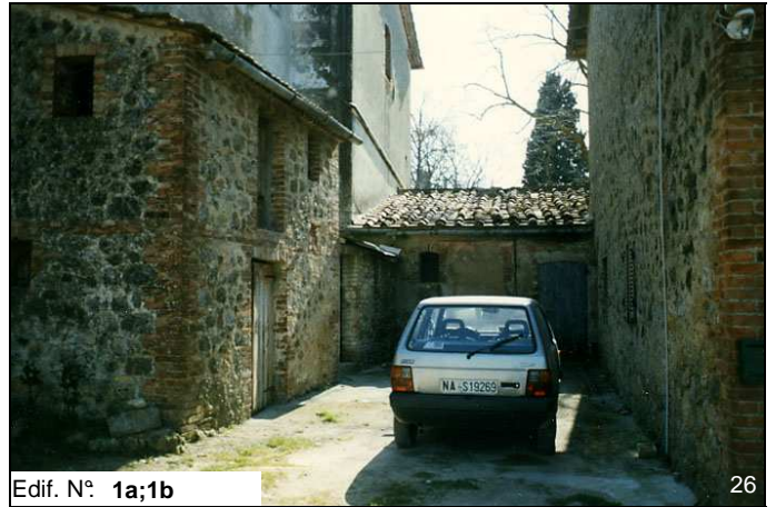
Edif. N° 1a;1b