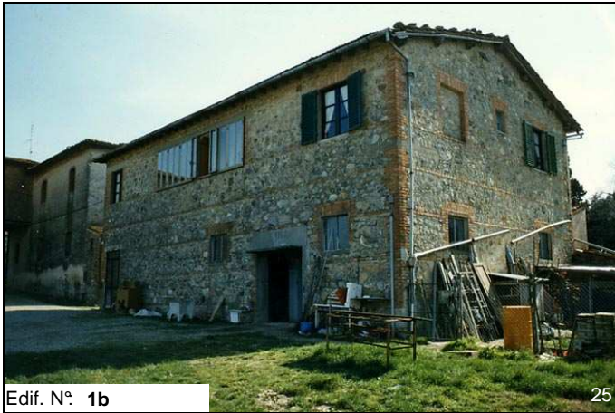
Edif. N° 1b