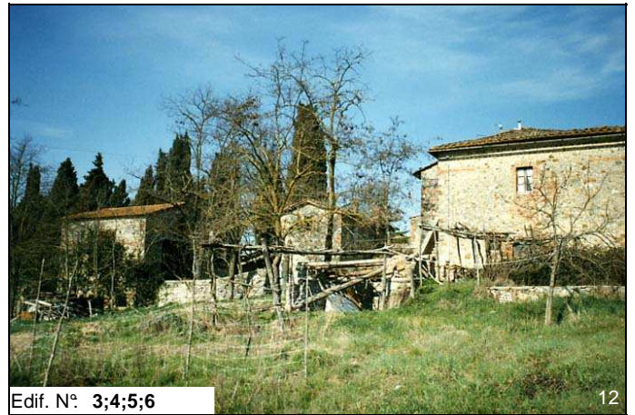
Edif. N° 3;4;5;6