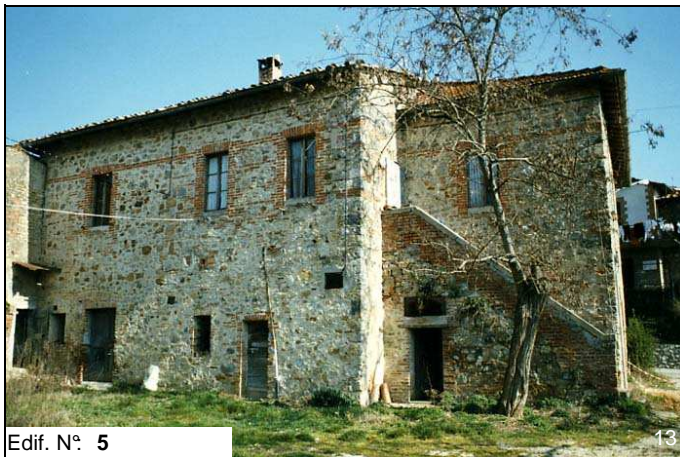
Edif. N° 5