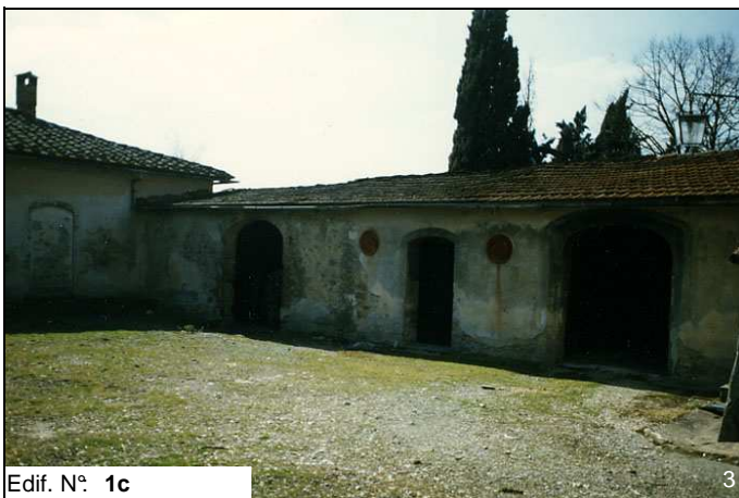
Edif. N° 1c