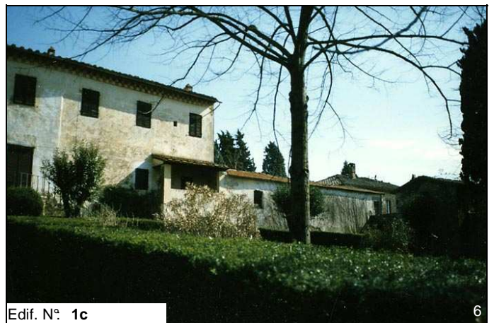
Edif. N° 1c