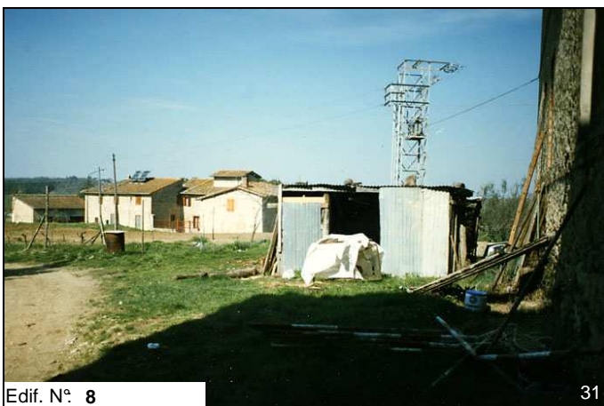
Edif. N° 8