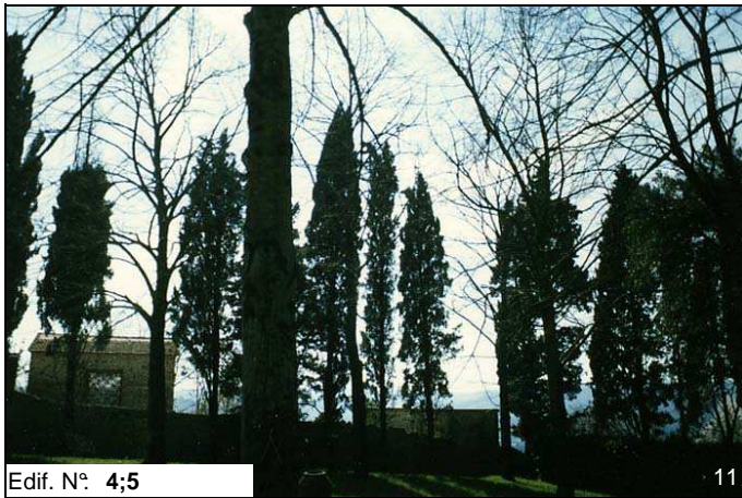
Edif. N° 4;5