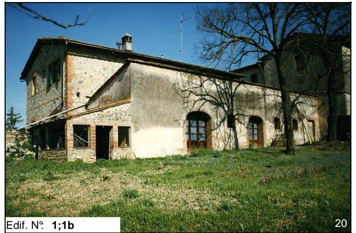
Edif. N° 1;1b