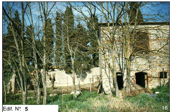
Edif. N° 5