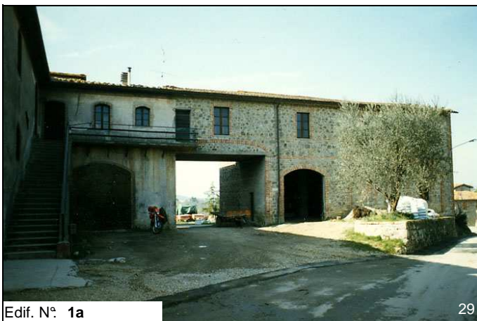
Edif. N° 1a