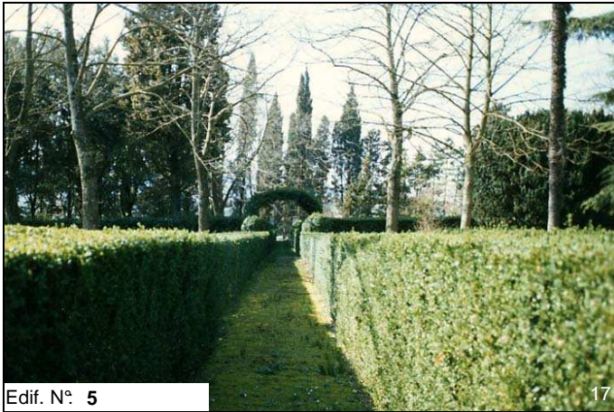
Edif. N° 5