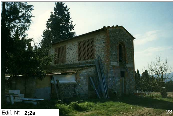
Edif. N° 2;2a