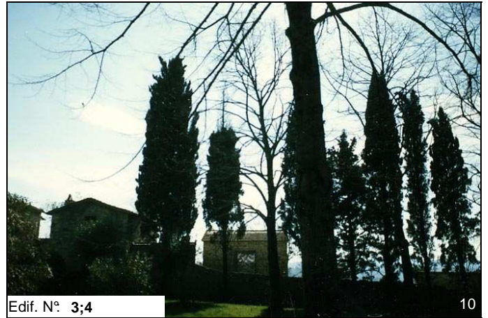
Edif. N° 3;4