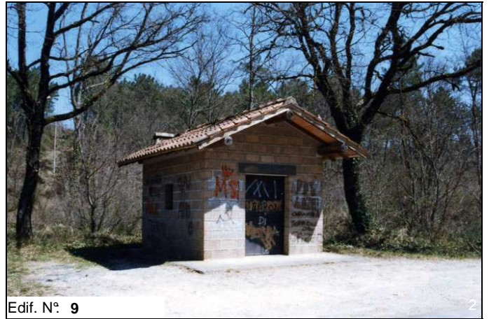
Edif. N° 9