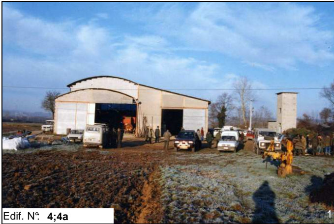
Edif. N° 4;4a