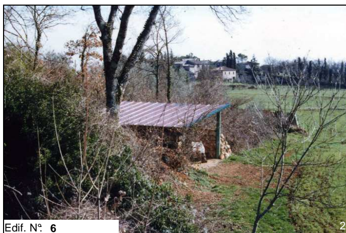
Edif. N° 6