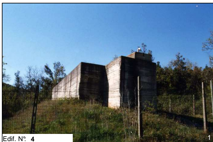
Edif. N° 4